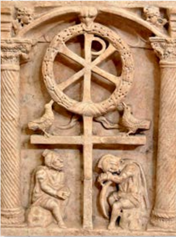
Автор неизвестен. Панель римского саркофага. Музей Пио-Кристиано. Ватикан, сер. IV в.