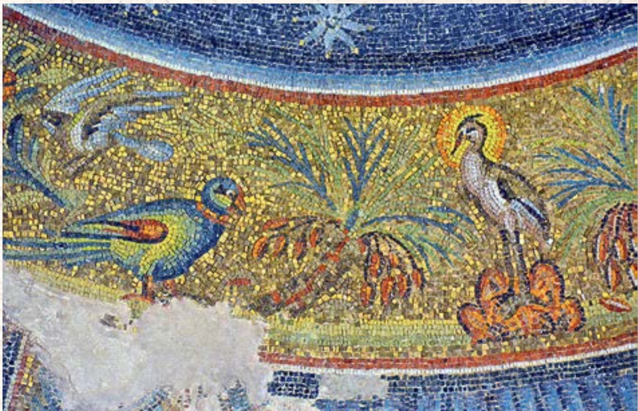
Автор неизвестен. Фрагмент мозаики с изображением феникса. Баптистерий Сан-Джованни-ин-Фонте, Неаполь, конец IV в.