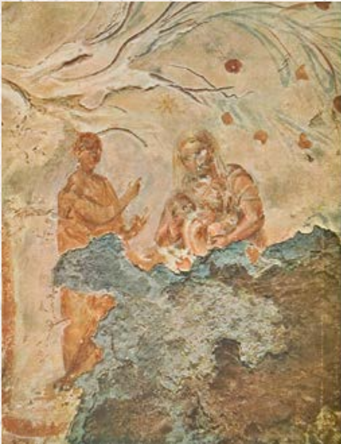
Автор неизвестен. Богородица с Младенцем и пророком Валаагом. Катакомбы Присциллы. Рим, втор. пол. II в. – пер. пол. III вв. Из книги Йозефа Вильперта Die Malereien der Katakomben Roms (Tafeln) , 1903

В живописи катакомб можно встретить и образы молящихся людей — орант . Некоторые женские изображения можно соотнести с Богородицею. Отметим, что образ Богородицы появляется в катакомбах раньше, чем образ Христа в человеческом облике. Наиболее древнее изображение Богородицы в катакомбах Присциллы датируется II веком: Мария представлена сидящей с Младенцем на руках, а рядом находится молодой человек, указывающий на звезду (им может быть пророк Исаия, Валаам или, например, муж Марии — Иосиф Обручник). Фигуры орант исполнены в фас, тело трактовано плоскостно, одежда, руки, а иногда и лицо изображены схематически. В их трактовке отчетливо проступают зачатки христианского спиритуализма, стремящегося к передаче не реальных физических черт, а духовного образа.