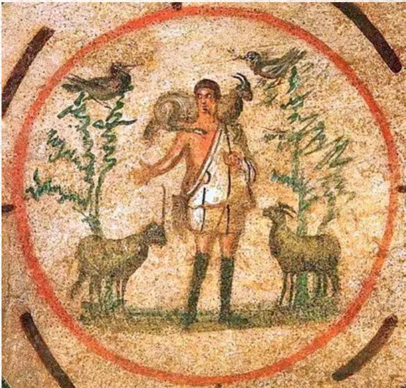
Автор неизвестен. Добрый пастырь . Катакомбы Присциллы. Рим, III в.

монограммы часто можно увидеть буквы \alpha — «альфа» и \omega — «омега». Они символизируют Христа, отсылая нас к тексту Откровения: