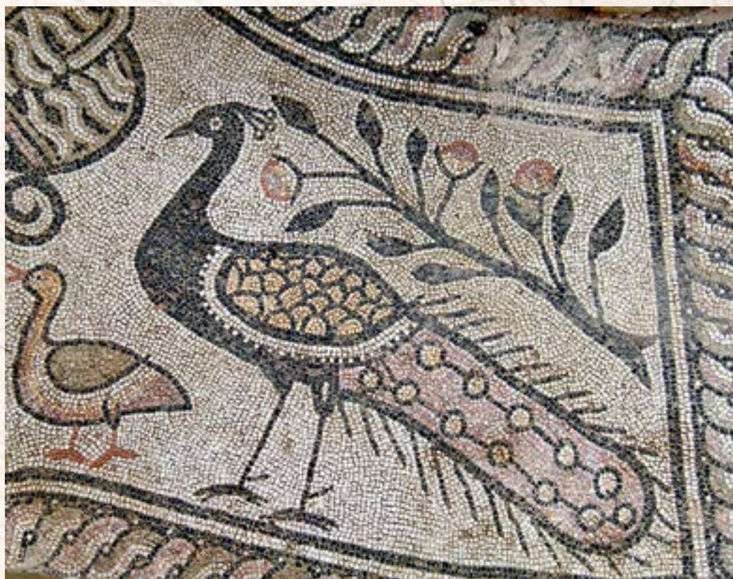
Автор неизвестен. Фрагмент мозаики с изображением павлина. Баптистерий Епископской базилики, Стоби, V в.