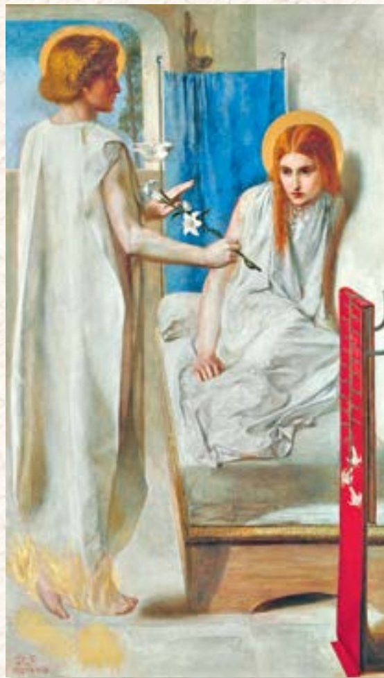
Данте Габриэль Россетти. Благовещение . Британская галерея Тейт. Лондон, 1850

Еще одной важной для ранних христиан птицей является голубь , которого можно увидеть, например, в катакомбах Святых Петра и Марцеллины. Голубь символизирует Святого Духа, таинство крещения, а также надежду, которую даровал людям Христос. Подобное изображение также является отсылкой к мифу о Ное, который послал голубя искать земли после Потопа, и когда тот вернулся с оливковой ветвью, это означало спасение людского рода.