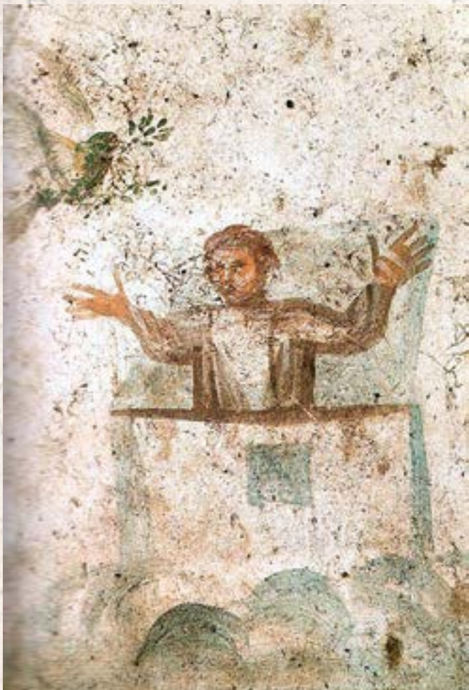
Автор неизвестен. Ной в Ковчеге . Катакомбы Святых Петра и Марцеллина. Рим, III–IV вв.