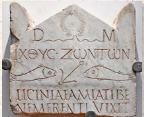
Автор неизвестен. Погребальная стела Лицинии Амиас . Эпиграфический музей Афин. Афины, III в.

Автор неизвестен. Vindemia (Сбор винограда) . Мавзолей Констанции. Рим, 330–350