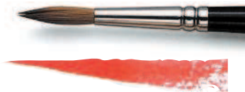
КРУГЛАЯ КИСТЬ № 6

Различные формы и размеры кисти позволяют реализовывать разные эффекты. Поскольку плоские кисти хорошо удерживают краску, а также быстро и равномерно распределяют ее по бумаге, именно они лучше всего подходят для того, чтобы накладывать красочные слои. Средние и крупные круглые кисти способны воспроизвести практически любой мазок, который может вам понадобиться, но чтобы научиться правильно ими работать, необходимо некоторое время попрактиковаться. Маленькие кисти обеспечивают контроль над мазком, столь необходимый при рисовании мелких деталей, но когда вам нужно провести более густую и более чистую линию по большей области, стоит попробовать сделать это краем плоской кисти.