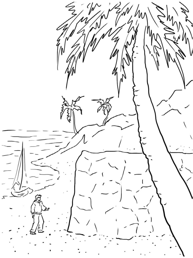
Рис. 2. Задача Эдисона: надо без всяких орудий сдвинуть с места трехтонную гранитную скалу в 100 футов длины и 15 футов высоты

Задача кажется неразрешимой. Что поделаешь голыми руками с трехтонной каменной глыбой таких внушительных размеров?