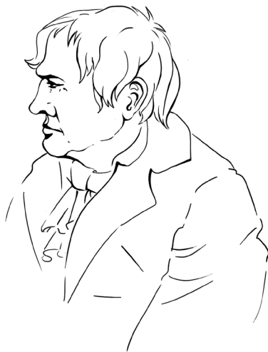
Рис. 1. Эдисон на склоне лет. Он умер в 1931 г.

«Вообразите, что вы очутились на тропическом острове Тихого океана без всяких орудий. Как сдвинули бы вы там с места