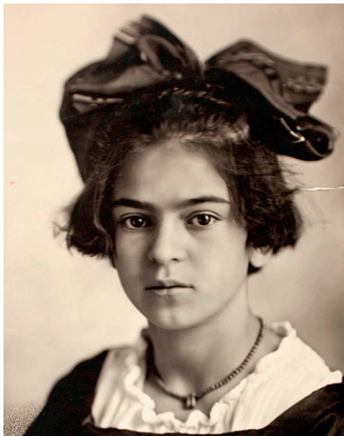
Фото 1919 г.

Эта дуальность — любовь и боль — станет позже лейтмотивом многих картин.