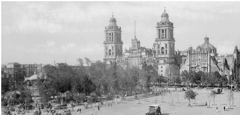
◀ Мехико в начале XX в. Вид на Кафедральный собор Пресвятой Богородицы. Фото ок. 1905–1910 гг.

Долгое лечение и реабилитация отдалили ее от обычной детской жизни. Фрида значительно позже, чем ее сверстники, начала систематическое обучение: детский сад, начальная школа, немецкая школа. Уже тогда девочка начала проявлять характер: учителя и воспитатели отзывались о ней как о «сорванце» и «мальчишке в юбке». Возможно, таким образом — от противного — Фрида пыталась бороться с неуверенностью и комплексами. Борьба оказалась успешной: у нее появились друзья, которые не обращали внимания на физический дефект, видя в девочке прежде всего живость, чувство юмора и смелость, граничившую с отчаянностью.