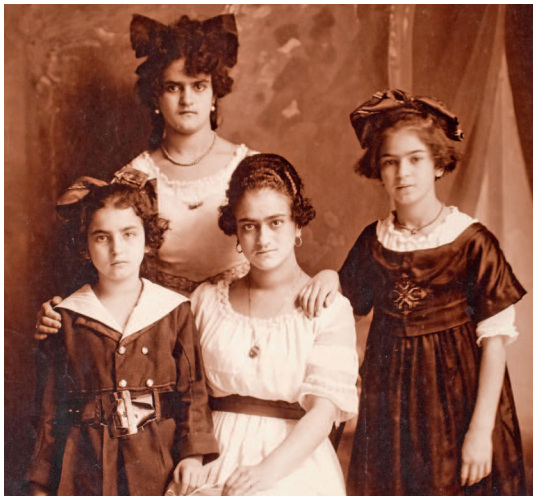
Фрида (крайняя справа) с сестрами. Фото 1916 г.