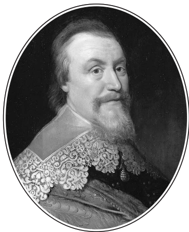
Риксканцлер Швеции граф Аксель Густавссон Оксеншерна (1583–1654)

смысле слова почти не существовало. Полная фактическая независимость феодалов от призрачной королевской или императорской власти превращала Европу в Средние века (до XV—XVI столетий) в конгломерат из нескольких тысяч карликовых «государств», непрерывно ссорившихся, мирившихся, снова дравшихся, снова мирившихся, и все это с непосредственной целью урвать лишний кус земли, или ограбить соседний замок, или угнать скот, принадлежащий чужой деревне.