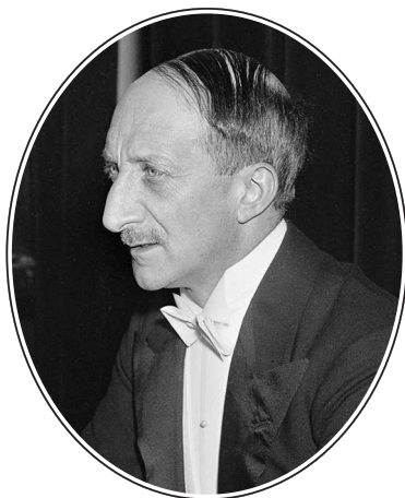
Министр финансов, министр иностранных дел Франции Жорж Этьен Бонне (1889–1979)

иностранных дел в кабинете Даладье Жорж Бонне вовсе не был «обманут» Гитлером, а сознательно и с полнейшей готовностью столкнулся с Гитлером и умышленно ему помог. Во-вторых, нынешний критик действий Жоржа Бонне не понимает (или не хочет понять), что Талейран жил и действовал в эпоху круто идущего в гору капиталистического развития, в эпоху начавшегося и быстро прогрессирующего расцвета буржуазного класса Франции, когда этот класс еще мог и хотел отстаивать свои интересы и свои претензии перед лицом буржуазии других стран всеми имеющимися у него средствами: то огнем и мечом, то дипломатическим искусством.