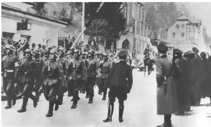
Вступление немецких войск в Австрию у Ниферсдорфа

Германия присоединяет Австрию (так называемый Аншлюс). Австрия (нем. Österreich), официальное название — Австрийская Республика (Republik Österreich) — государство в центре Европы. Название страны происходит от древнегерманского Ostarrichi — «восточная страна».