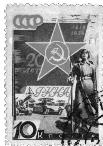
Почтовая марка 20 лет РККА, 1938 г.

★ МИД Великобритании так комментировал это предложение: «Москва, возможно, в состоянии обеспечить оборону собственной территории», но не сможет, «даже если захочет, предложить полезную активную помощь за пределами своих границ. Данные, имеющиеся у нашей секретной разведывательной службы, говорят о том же. Мощь советской армии подорвана чистками; советские военно-воздушные силы, хотя и внушительны по численности, не отвечают современным требованиям; советский военно-морской флот, вероятно, не в состоянии сделать многое против германских ВМС в Балтийском море». Вывод МИД Великобритании был неутешительным: «Соглашение не обеспечит в значительной степени дополнительной безопасности; оно вызовет подозрения наших друзей и усилит враждебность врагов». Начальники штабов Великобритании подготовили меморандум, в котором говорилось, что в случае, если не удастся добиться никакого соглашения с СССР, то это только подтолкнет Гитлера к очередной агрессии и «в конце концов толкнет СССР в ее объятия». Польша была решительно против альянса с СССР: если Германия объявит войну Великобритании или Франции, Польша и СССР объявят войну Германии, и тогда Москва направит свои танки и самолеты через территорию Польши, а это пугало Варшаву. СССР в своих предложениях выдвинул интересный пункт о защите Литвы, Латвии, Эстонии, Финляндии — то есть о защите своих западных границ и легальной возможности направить свои войска в любую из этих стран. Ни