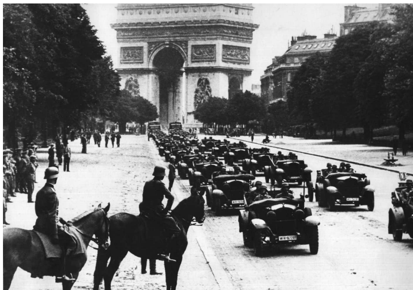
Парад немцев в Париже, 1940 г.

тральные страны Бенилюкса. Люксембург оккупирован 10 мая; Нидерланды сдаются 14 мая; Бельгия — 28 мая.