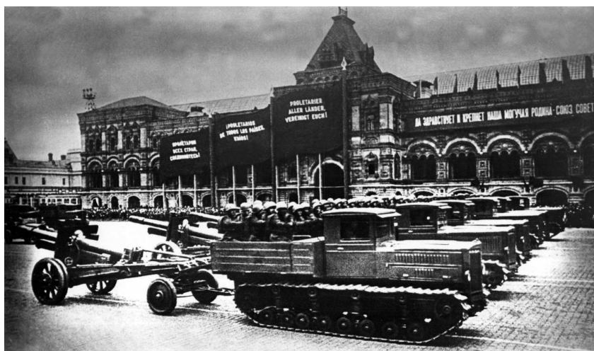
Артиллерия на параде, 1 мая 1940 г.

ного объяснения этому приказу нет; демонтировав старые УР и так и не достроив к началу войны новые, наше командование лишило отступающую армию возможности закрепиться хотя бы по линии старой границы. Но, может быть, смысл приказа был именно в этом: командующие должны были сознавать, что за спиной у них других укреплений нет, значит, биться нужно только на границе, «не отдавая ни пяди своей территории». Недаром в начале войны некоторые командующие отдавали при-