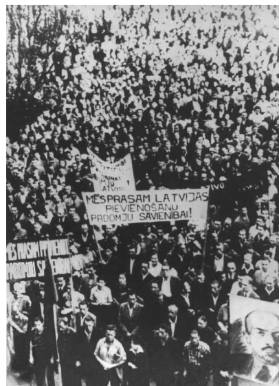
Рига. Демонстрация трудящихся с требованием присоединения Латвии к СССР

★ Советский военный атташе в Берлине генерал Туников через 11 дней после принятия