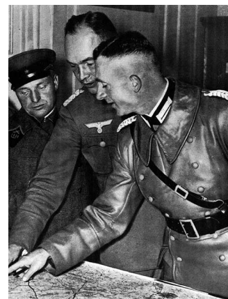
Немецкие офицеры в Белостоке проводят демаркационную линию в присутствии командира Красной Армии, 1939 г.

★ Германия и Советский Союз подписывают пакт о ненападении и секретное приложение к нему, по которому Европа разделяется на сферы влияния.