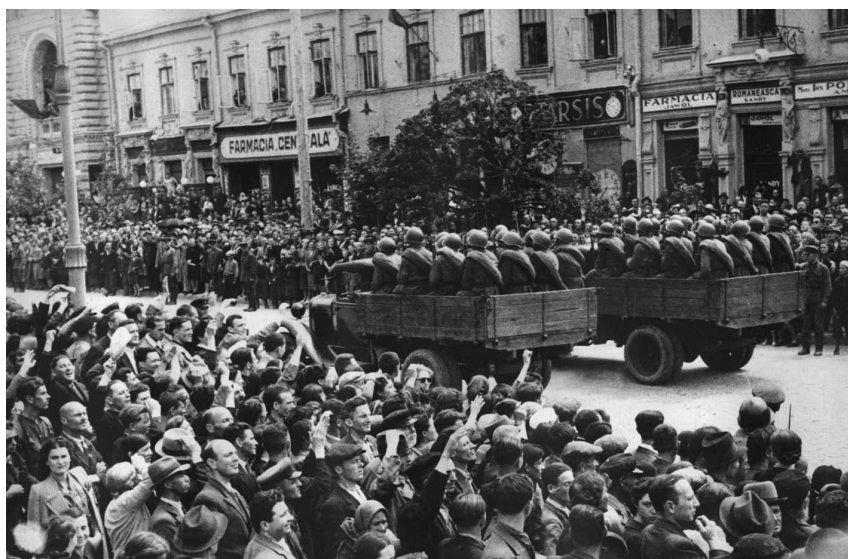
На параде Красной Армии в Кишиневе 3 июля 1940 года в связи с освобождением Бессарабии