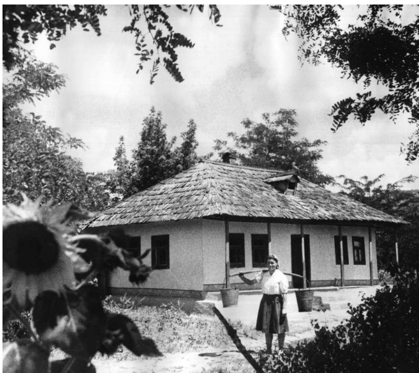
Усадьба молдавского крестьянина, 1930-е гг.

Великобритания и Франция потому настаивали на «соглашении трех» — Лондона, Парижа и Москвы: в случае если бы Франция и Великобритания оказались в состоянии войны с Германией из-за взятых уже ими обязательств перед Польшей и Грецией, СССР оказал бы им немедленно помощь и поддержку, и наоборот.