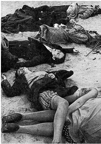
Польша, 1939 г.