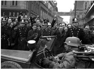
Немецкие войска вступают в Прагу, 1939 г.

27 сентября сдается Варшава. Польское правительство отправляется в изгнание через Румынию.