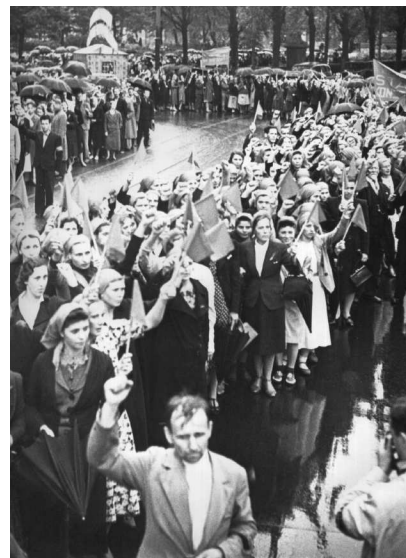
200-тысячная демонстрация в честь принятия Латвии в состав СССР, 6 августа 1940 г.

Гитлером «плана Барбаросса» докладывал в Москву: «...(фамилия вычеркнута) сообщил, что... (фамилия вычеркнута) от высокоинформированных источников