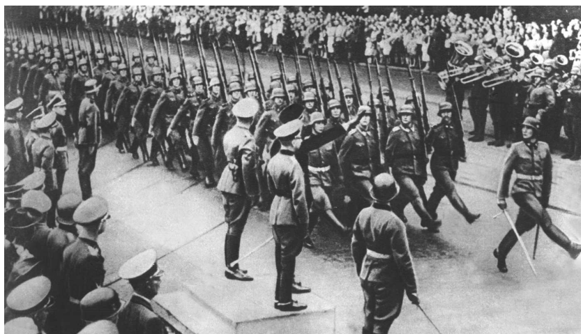
По главной улице Берлина маршируют отличившиеся в войне против Польши и Франции

В южной части Франции устанавливается коллаборационистский режим со столицей в городе Виши.