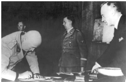
Муссолини подписывает Мюнхенское соглашение

★ Германия присоединяет Австрию (так называемый Аншлюс).