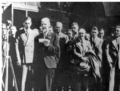
Принятие Латвии в состав СССР. Рига 30 июля 1940 года. У микрофона — председатель Народного правительства профессор А. Кирхинштейн

★ Под Новый год в «Известиях» опубликована статья «Уран-235», которую заключала фраза «Физика стоит перед открытия-