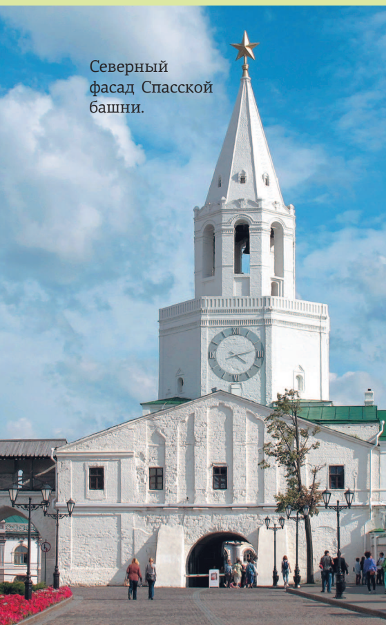
Северный фасад Спасской башни.

В 1555 году прибывшие в Казань псковские зодчие возвели на месте деревянной Спасской церкви одноименную проездную башню из тесаного белого камня — известняка.