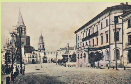
Здание Казанской городской думы. Фото начала XX в.