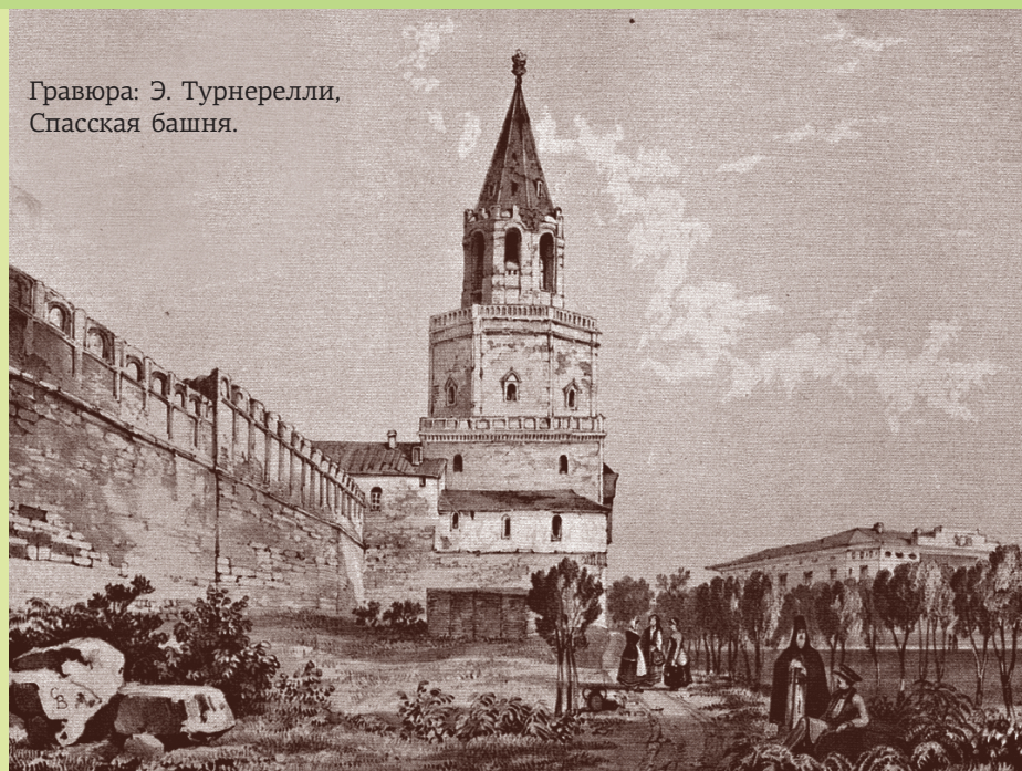
Гравюра: Э. Турнерелли, Спасская башня.