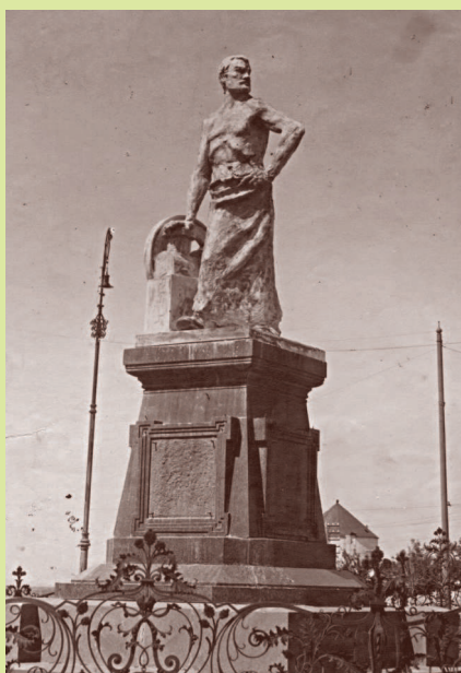
Памятник «Освобожденный труд», скульптор Василий Богатырев.

Площадь перед Кремлем одна из старейших в Казани. Ее история насчитывает более пяти столетий. Она возникла как часть казанского посада и была центральной площадью города в XVI–XIX веках. Здесь оглашали государственные указы, приводили в исполнение публичные наказания, проводили торжественные церемонии.