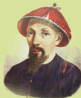
Иакинф в китайском одеянии. Литография А. Орловского, 1828 г.

Интересно, что в 1800–1802 годах настоятелем монастыря был Иакинф Бичурин — впоследствии ученый-востоковед, получивший общеевропейскую известность. Его называют основоположником отечественного китаеведения.