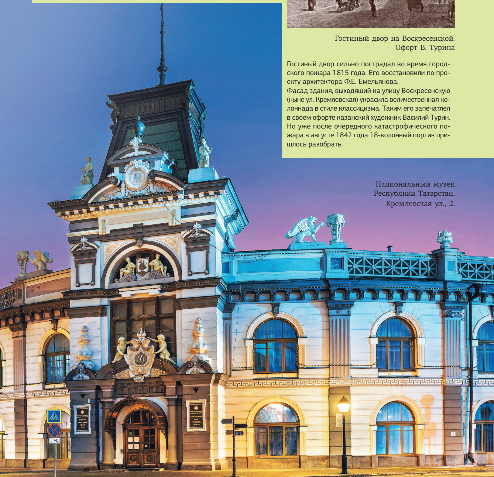
Национальный музей Республики Татарстан. Кремлевская ул., 2.

Фасад здания, выходящий на улицу Воскресенскую (ныне ул. Кремлевская) украсила величественная колоннада в стиле классицизма. Таким его запечатлел в своем офорте казанский художник Василий Турин. Но уже после очередного катастрофического пожара в августе 1842 года 18-колонный портик пришлось разобрать.