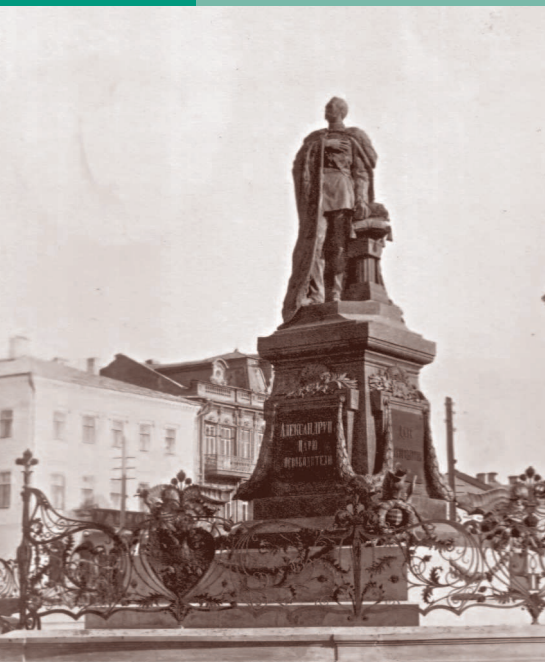
Памятник Александру II на Ивановской площади (ныне Площадь 1-го мая).