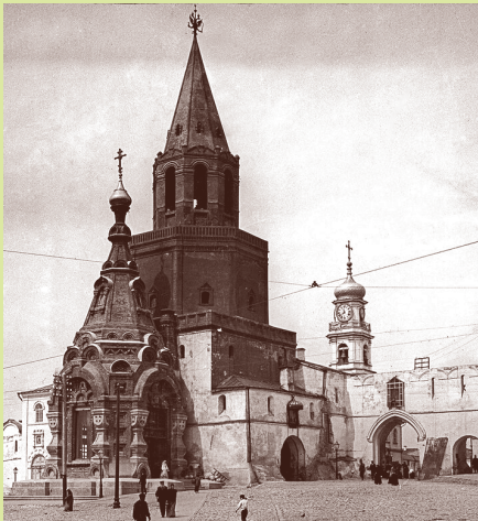
Спасская башня и Спасская часовня, фото 1910–1917 года.

Интересно, что годов до 1950-х Спасская башня была полихромной. Проще говоря — разноцветной. Два ее нижних яруса XVI века оставались белокаменными, а надстроенные в XVIII веке верхние были выложены из красного кирпича. Затем, как и все остальные башни Кремля, ее стали белить. По всей видимости, главным образом из практических соображений: известь предотвращает образование грибка на стенах.