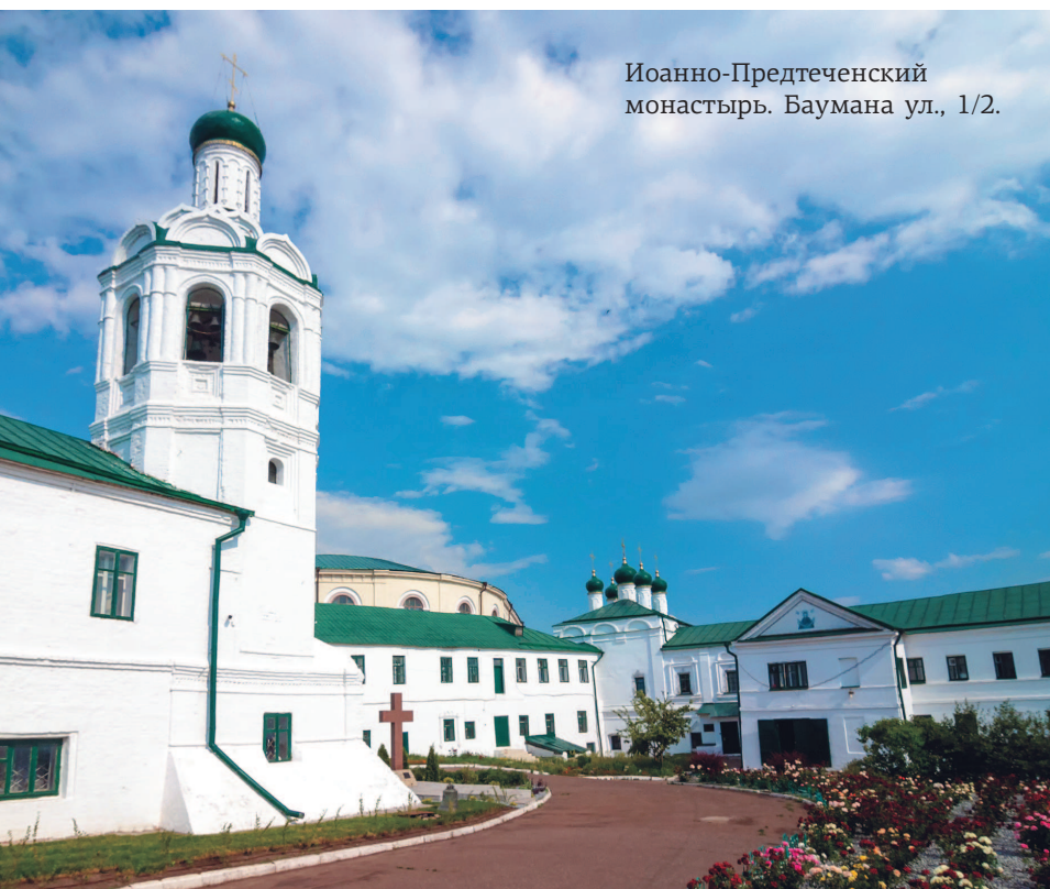
Иоанно-Предтеченский монастырь. Баумана ул., 1/2.

Внешний вид древнего трехшатрового храма Иоанно-Предтеченского монастыря известен по литографии английского художника и путешественника Эдуарда Турнерелли. Он же оставил его словесное описание: «С высоты крепости обитель выглядит чрезвычайно живописно. Три колокольни в форме пирамиды символизируют... святую Троицу, в честь которой построена монастырская церковь. Сводчатая галерея, переходящая в башню, напоминает храмы Италии. В часовой у главного входа видны монахи, одетые в черное. Все это надолго остается в памяти путешественника».