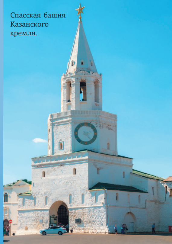
Спасская башня Казанского кремля.

По преданию, во время штурма Казани в октябре 1552 года здесь стоял боевой стяг Ивана Грозного с образом Спаса Нерукотворного. После падения ханской столицы царь повелел построить на этом месте церковь. Первоначально деревянная, она стала одной из трех самых древних церквей города.