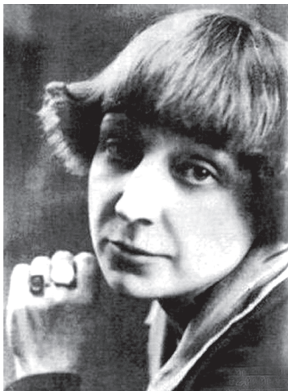
Марина Ивановна Цветаева

мать. Марине Цветаевой на тот момент было неполных 14 лет. Возвратившись в Москву, сестры Цветаевы завершали среднее образование, переходя из одной московской гимназии в другую и с трудом вписываясь в существующие на тот момент представления о манерах и образе жизни несовершеннолетних барышень. У них был довольно разномастный багаж знаний и представлений о мире и себе. К этому моменту Марина, хорошо знавшая французский, уже попробовала себя в качестве переводчика — перевела пьесу Эдмона Ростана «Орленок». Летом 1909 года она отправилась в Сорбонну — слушать курс старинной французской литературы.