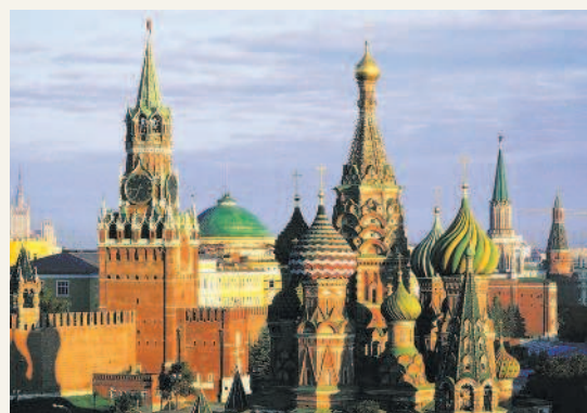
Москва — столица Российской Федерации