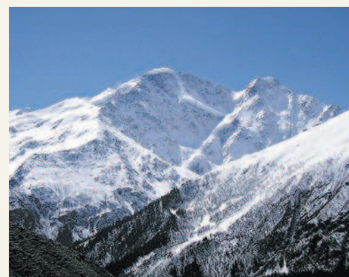
В горах Кавказа