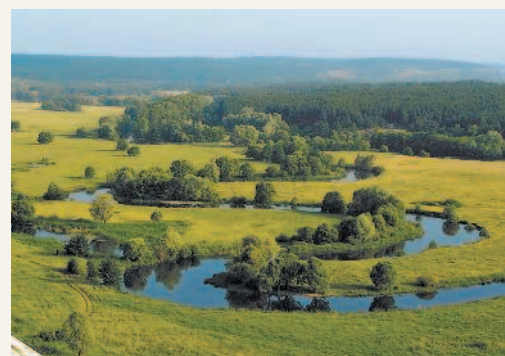
На Русской равнине