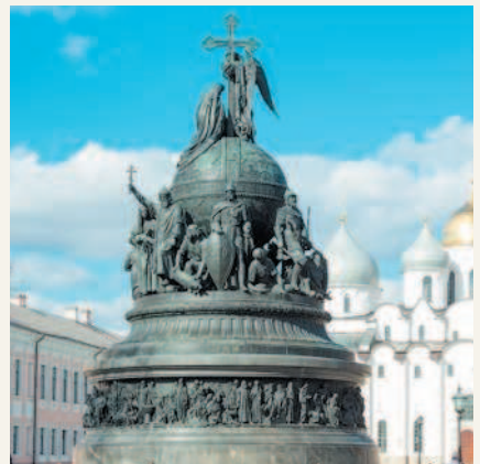
Памятник «Тысячелетие России» Великий Новгород. Кремль