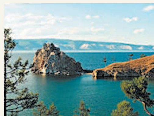
Байкал — природная жемчужина России

рии. В одном озере Байкал содержится около 19% мировых запасов пресной воды. Половина всех земель России занята лесами. Леса играют важную роль в газовом балансе атмосферы и регулировании планетарного климата Земли. В России находится пятая часть всех лесов мира и половина мировых хвойных лесов. Животный мир разнообразен. Количество видов животных на территории России достигает 125 тыс.