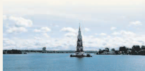
Волга в районе города Калезин