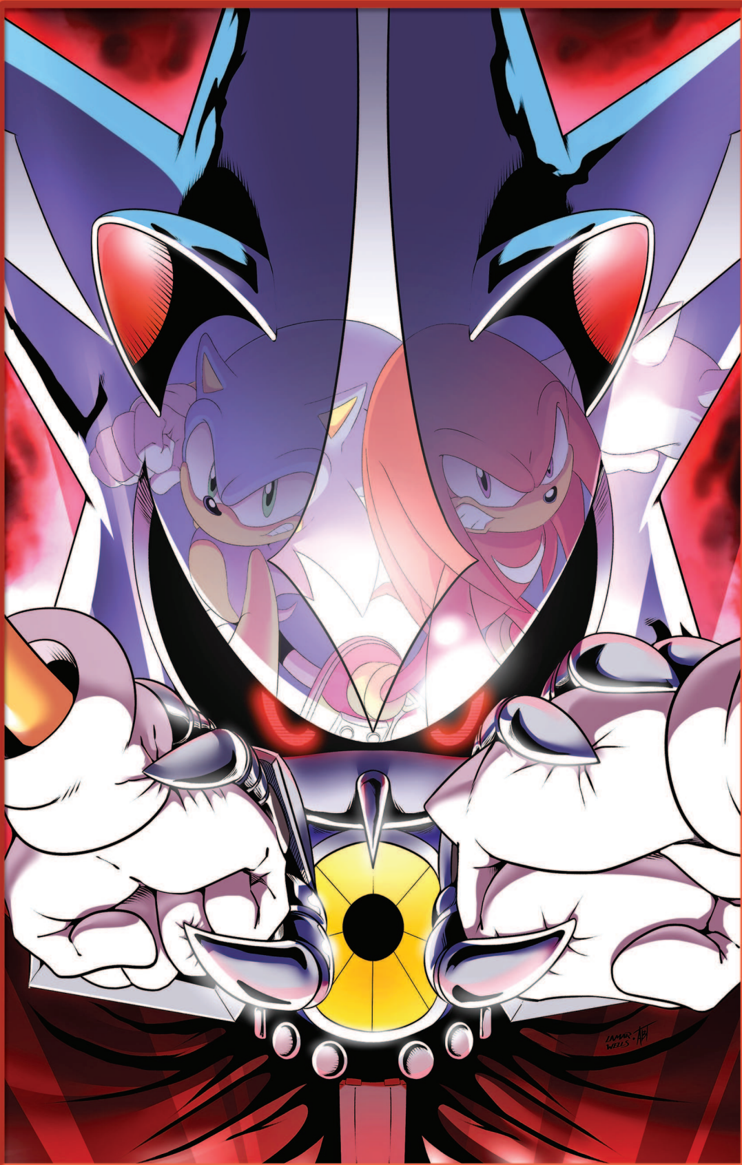
• РИСУНОК - ЛАМАР ВЭЛЛС и АДАМ БРЮС ТОМАС •