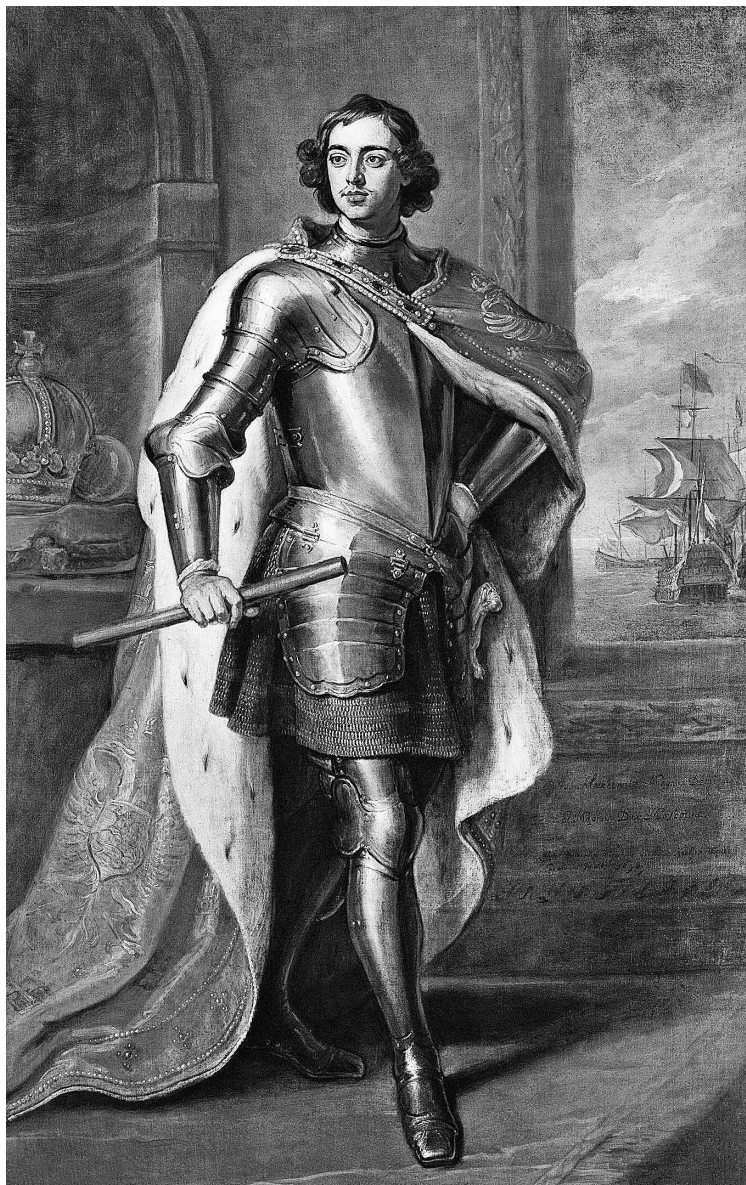
Император Петр I