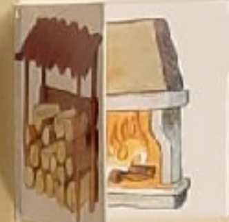
САРАИ ДЛЯ ДРОВ