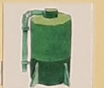
БУНКЕР ДЛЯ ЗЕРНА