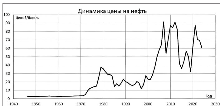
Рисунок 1. Динамика цены на нефть

и наращиваться переработка. Если цены снижаются, то и объем добычи будет снижаться, а капитал будет перераспределяться на более рентабельные отрасли. Но низкие цены не всегда заставляют экспортеров уменьшать добычу. Некоторые даже увеличивают ее. Это заставляет пересмотреть подходы к пониманию значения фактора цены на мировом рынке нефти. Средняя динамика цены на нефть представлена на рисунке 1.