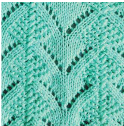
Раппорт узора 18 + 2 кром