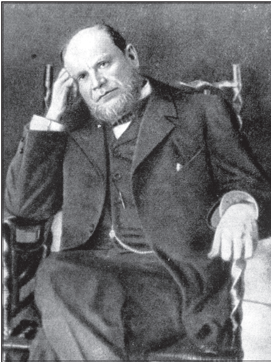
А. Ф. Кони (1844—1927).