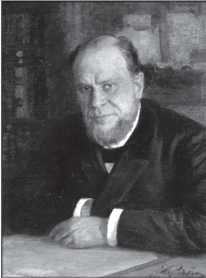
И. Е. Репин. Портрет А. Ф. Кони. 1898 г.

вызванными, как правило, устранением некоторых повторений фактического материала.