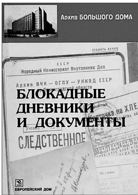
Книга «Блокадные дневники и документы». 2007 год