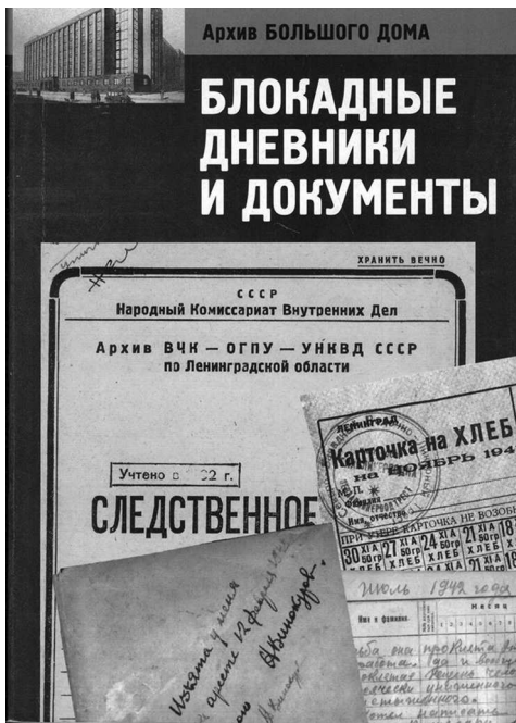
Книга «Блокадные дневники и документы». 2004 год

которые сохранились в спецхранах, а также фондах бывших партийных архивов и дошли до наших дней.