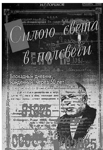
Книга «Силою света в полсвечи: Блокадный дневник, найденный через 50 лет в секретных архивах КГБ»

дневник, найденный через 50 лет в секретных архивах КГБ» 2 .