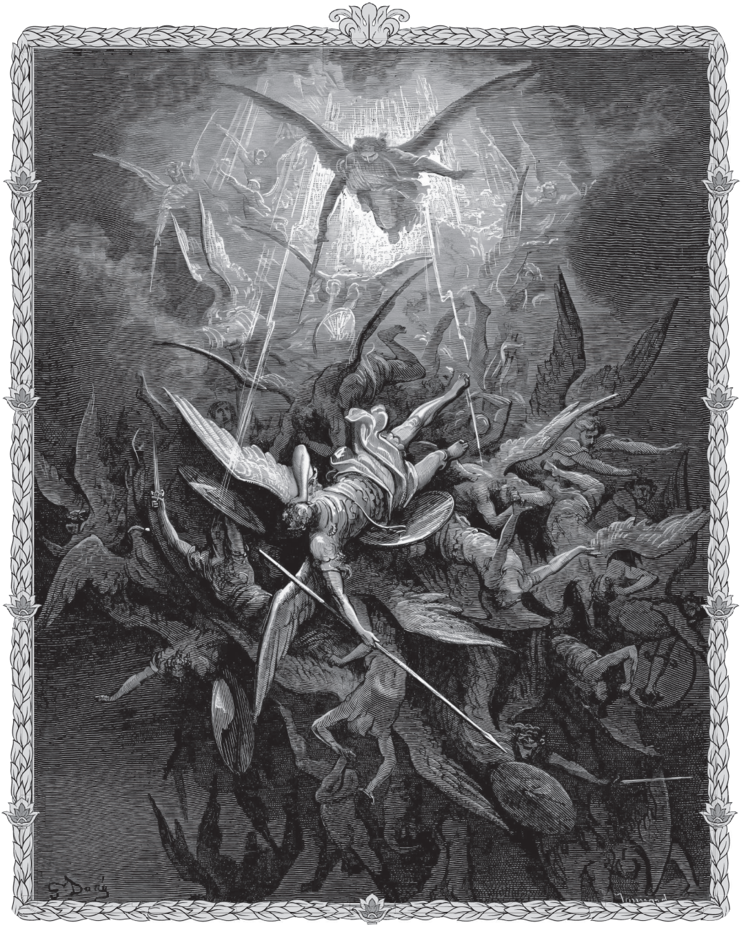
Him the Almighty Power Hurl'd headlong flaming from the ethereal sky Gustave Doré