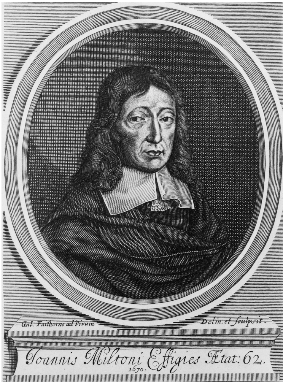
Portrait of John Milton Artist – William Faithorne 1670