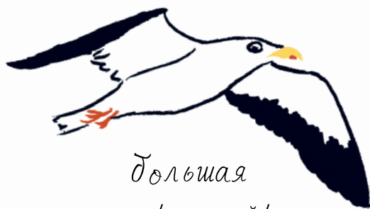
Большая морская чайка

Закончив есть, они убрали мусор, остатки еды и грязные тарелки в корзину. Всё это муми-тролли увезут с собой домой.