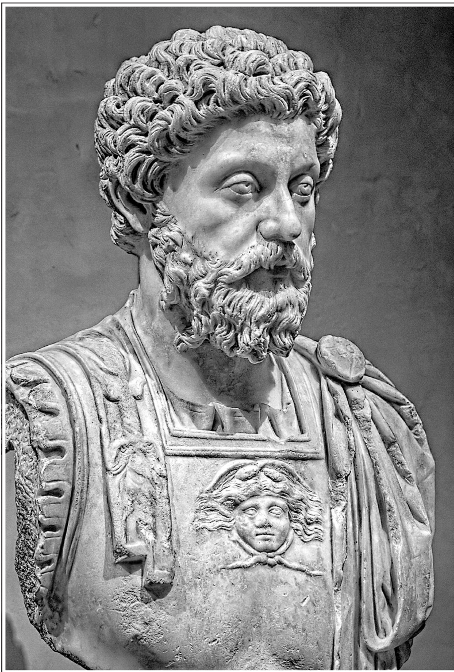
Бюст императора Марка Аврелия Антонина.