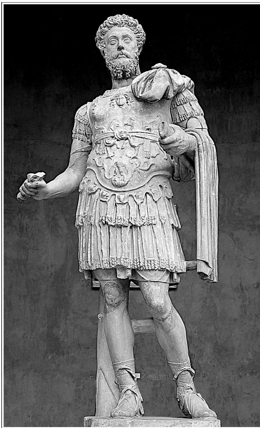
Марк Аврелий в императорском облачении.