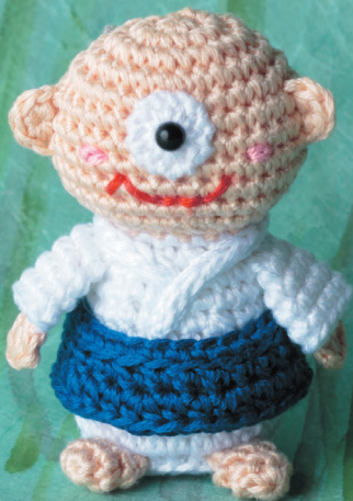
Схема: см. с. 52

В самом центре лба у него расположен большой глаз. Будьте осторожны, если собираетесь шалить или проказничать – он посмотрит на вас очень сердито.