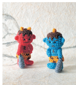
Красный и синий демоны-они