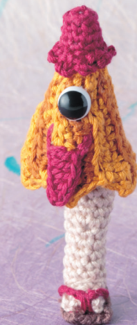
Схема: см. с. 47

Этот призрак изображается обычно с одной ногой, одним глазом и длинным языком. Ёкай живет рядом с людьми, и вы даже можете услышать стук его ноги: тук-тук, тук-тук.