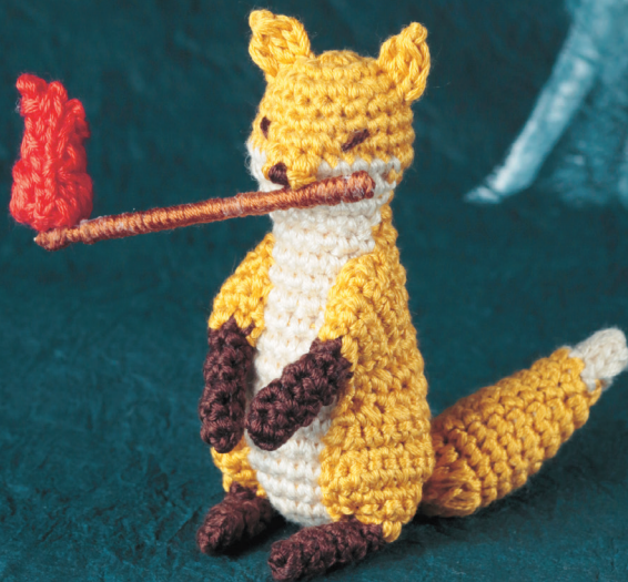
Схема: см. с. 64

Если вдруг вы заметите свет, похожий на таинственный блуждающий огонь, то вспыхивающий, то гаснущий, скорее всего вам повстречалась Кицунэби.