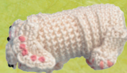
Схема: см. с. 55