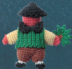
Схема: см. с. 59 Техника: см. с. 38 Дизайн и создание: Мацумото Каору