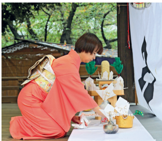
■ Чайная церемония