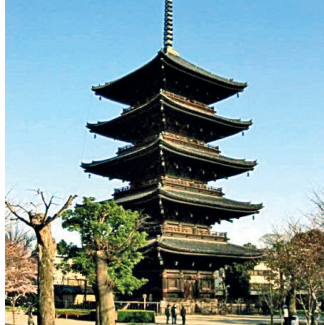
■ Храм Тодзи