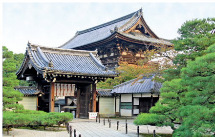
■ Киото, храм Ниннадзи

О существовании Японских островов Европа узнала только в начале XIV века от венецианского купца Марко Поло, который совершил путешествие в Китай. Самих островов Поло не видел, поэтому говорил о них как о Чипангу – Стране, где рождается солнце. Сами японцы до IX века называли свою страну Ямато – Большая гармония, а с X века – Нифон или Ниппон. В 1946 году Конституционная комиссия признала оба названия одинаково правомочными. Но когда в 1960-е годы страна готовилась к XVIII Олимпийским играм, вновь стал вопрос о названии. И Олимпийский комитет высказался за Ниппон – Начало Солнца. С тех пор именно так сами японцы называют свою страну. Ее флаг – красный солнечный диск на белом полотнище, и белый цвет говорит о чистоте помыслов, а солнце, как известно, символ японских императоров, ведущих свою родословную от богини солнца Аматэрасу. Когда японский флаг поднимается на флагштоке, звучит государственный гимн, начинающийся словами Кими га ё ва , что примерно означает «Пусть продлится Ваше господство». Под словом «Ваше» подразумевается, естественно, император. Официального герба страны не существует. В качестве него часто