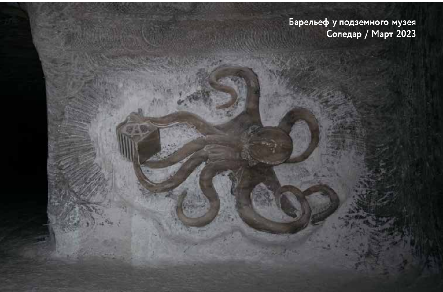
Барельеф у подземного музея Соледар / Март 2023