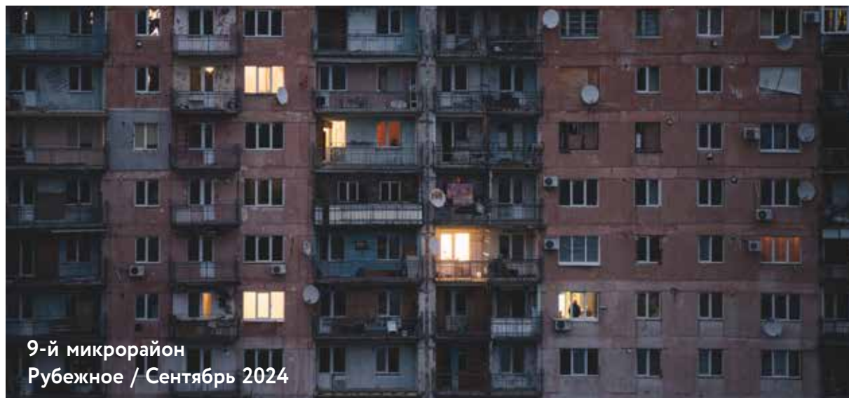
9-й микрорайон Рубежное / Сентябрь 2024

К концу советской эпохи Рубежное представлял собой пример индустриального города-комбината: с развитым химическим производством, социальной инфраструктурой, образцовой урбанистической планировкой.