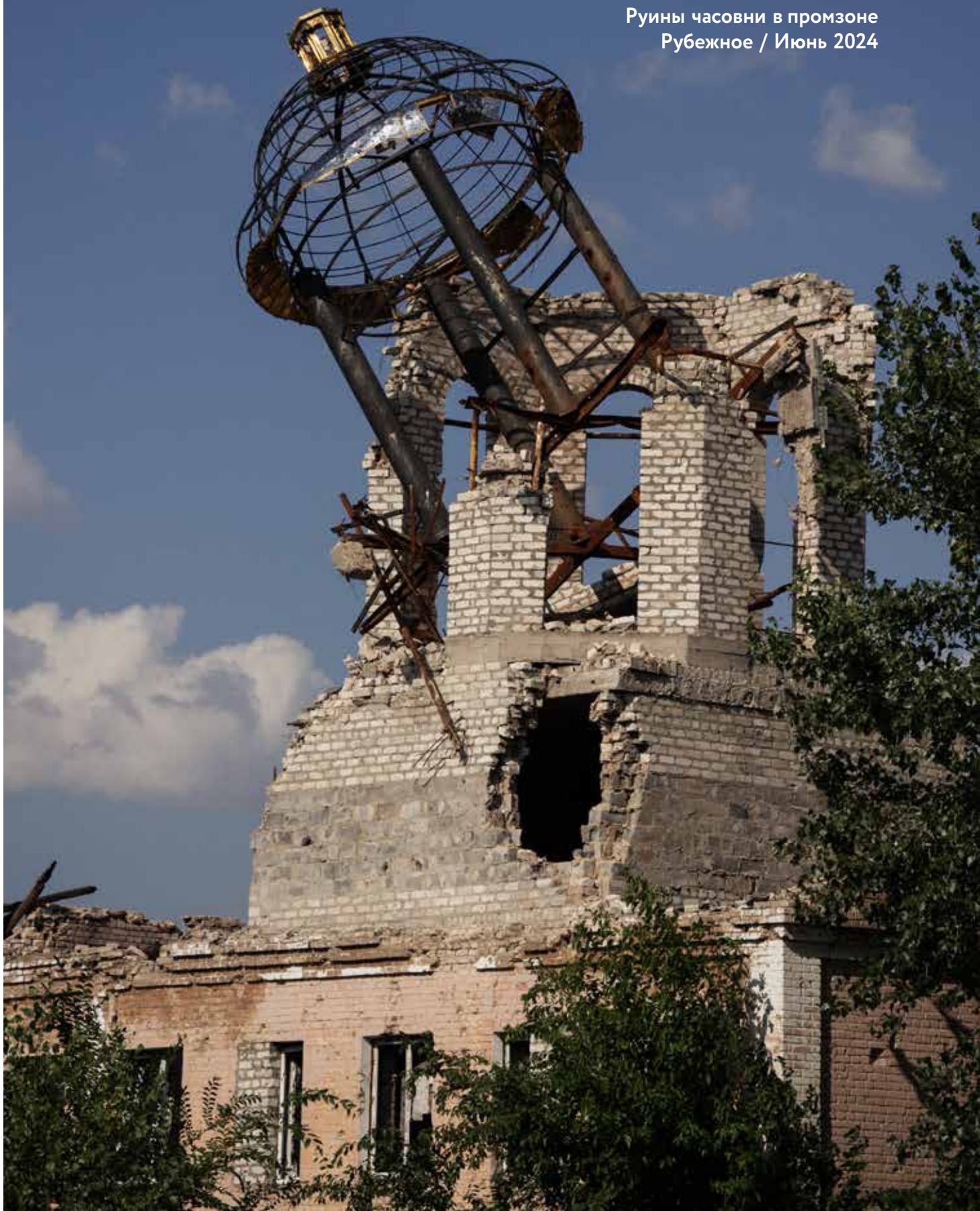
Руины часовни в промзоне Рубежное / Июнь 2024