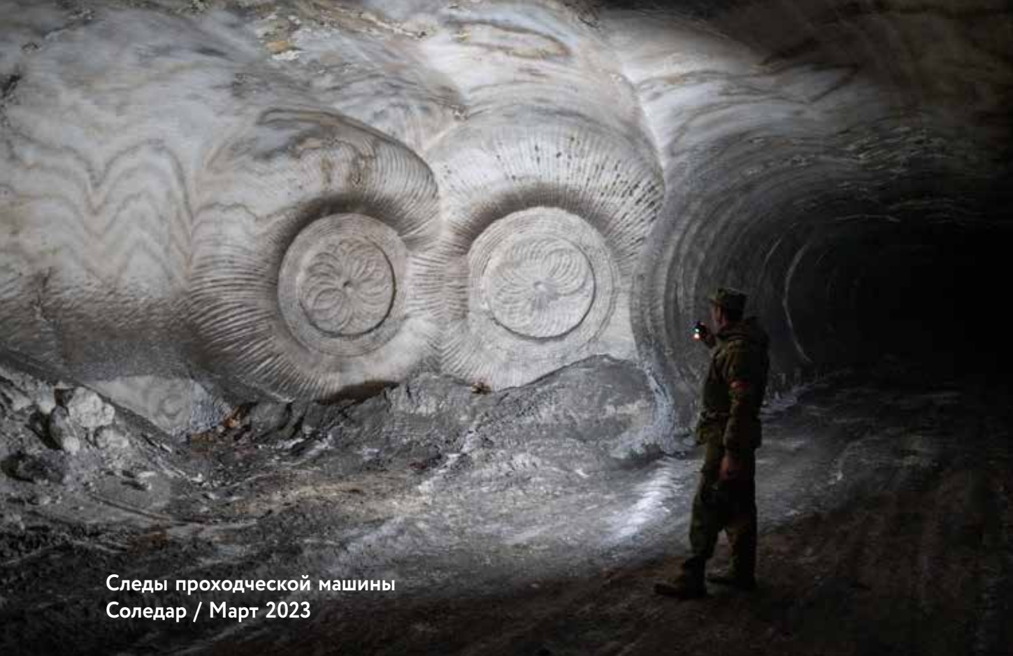
Следы проходческой машины Соледар / Март 2023