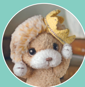
Львенок Лео 152