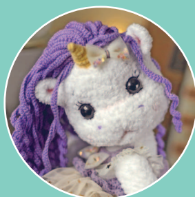
Единорожка Лили 93