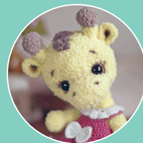
Жирафик Полли 129