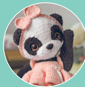
Панда Хляя 59