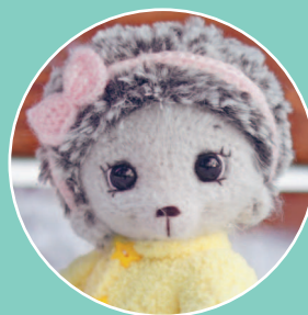
Ежик Софи 113