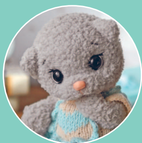
Кошечка Бетти 21