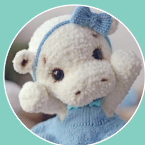
Бегемотик Эмма 76