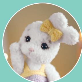
Зайка Мия 145