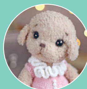
Собачка Мишель 163