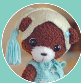
Мишка Бруно 40