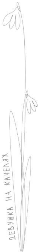
ДЕВУШКА НА КАЧЕЛЯХ

— Я не помню, как там оказалась, на дороге. Вернее, внизу, — поясняла девушка, пытаясь разобраться в своей ситуации.