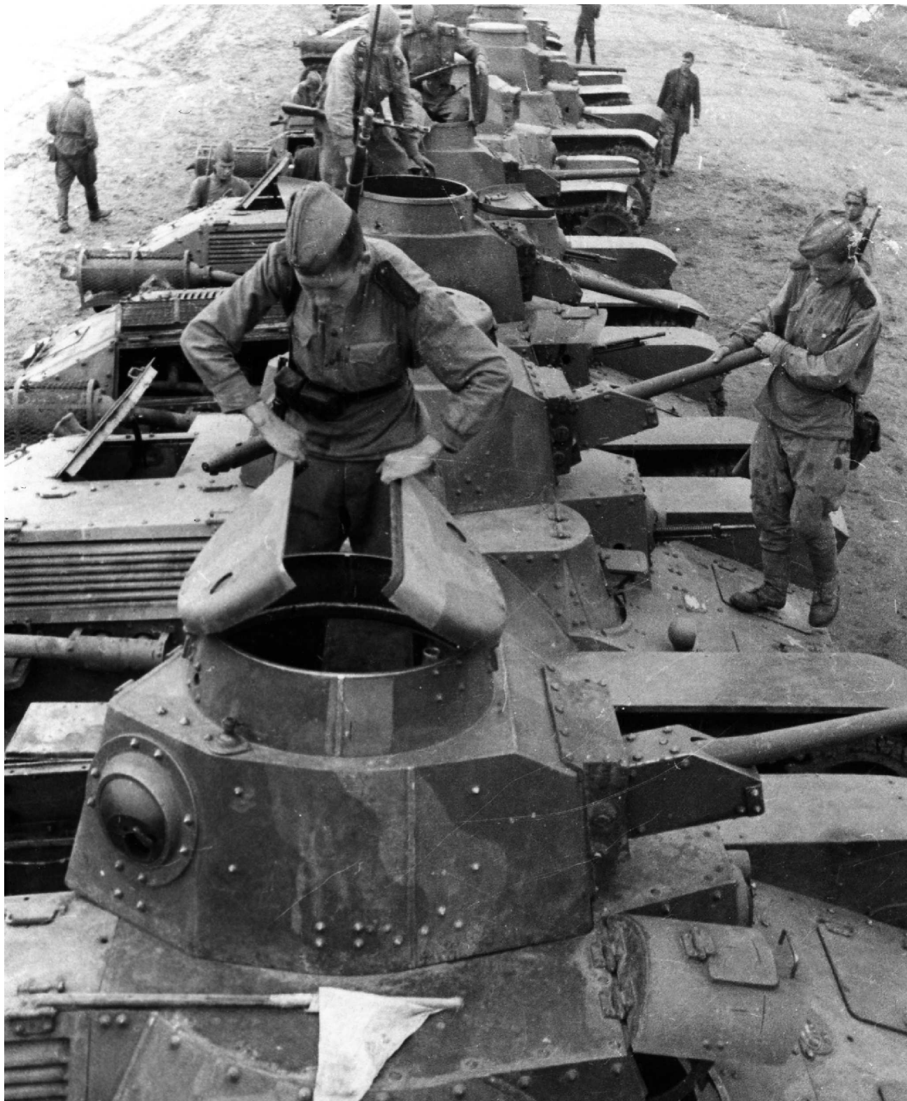
Бойцы Красной армии осматривают танки Тип 95 «Ха-Го», сданные при капитуляции японских войск. Маньчжурия, август 1945 г. На фото предположительно машины из состава 9-й танковой бригады Квантунской армии (АА)