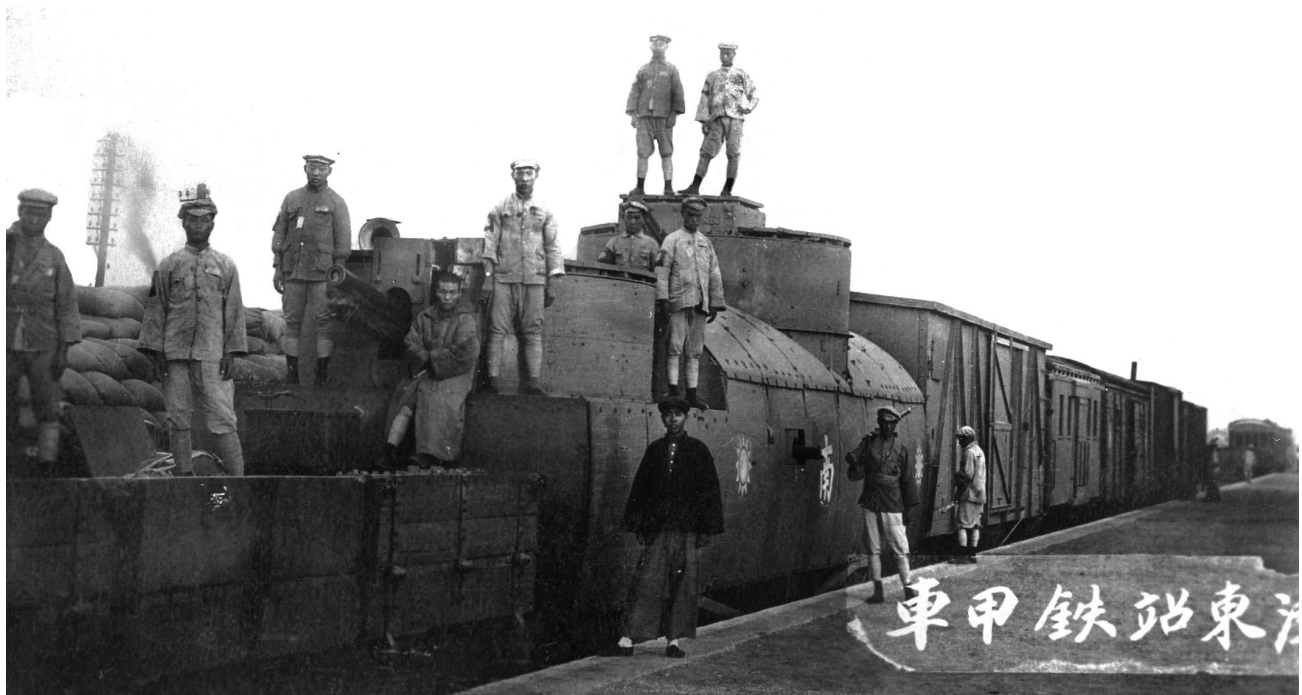
Бронепоезд китайской армии, 1930-е г. На борту видны эмблемы гоминдана и иероглиф «Юг». На фотографии написано «Бронированный поезд на восточном вокзале» (АА)

Гоминьдан заключает союз с коммунистами – они выступают за наведение порядка в стране и создание собственной армии. В мае 1924 г. было подписано соглашение между Китаем и СССР об установлении дипломатических отношений. По просьбе КПК и Гоминьдана советское правительство принимает решение об оказании им военной помощи. Для этого выделяется более 30 млн рублей, также в страну направляются 135 советских военных специалистов и вооружение. Только за 1926 г. китайцы получили 24 самолета, 205 орудий, 128 минометов, 295 пулеметов, 73 993 винтовки, 110 тыс. ручных гранат, 124 млн патронов, 50 тыс. артиллерийских снарядов, средства связи, инженерные средства, медикаменты и оборудование для госпиталей 1 . В военной школе в г. Вампу было организовано обучение кадров для новой Национально-революционной армии Китая. Летом 1926 г. созданные при помощи СССР войска выступили в так называемый Северный поход, план которого был разработан при участии советских военных советников, в частности В.К. Блюхера. Предполагалось взять под контроль Гоминьдана северную часть страны, коммунисты активно принимали в этом участие. В течение шести месяцев непрерывных боев от власти милитаристов удалось освободить центральные районы Китая, под контроль Чан Кайши перешел Шанхай,