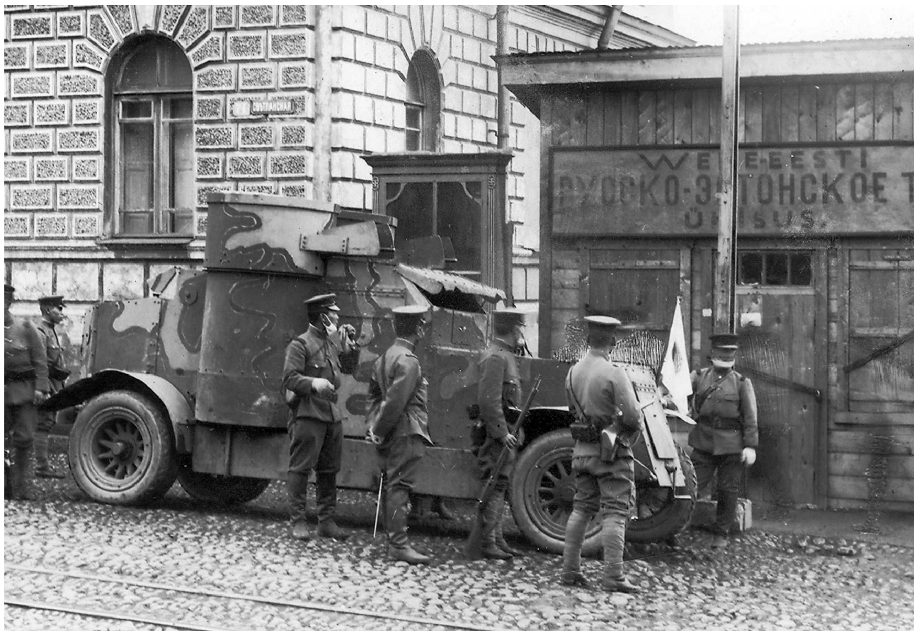
Бронеавтомобиль «Остин» японской армии на улице Владивостока. 1920 г.

КВЖД, а Корея признавалась сферой интересов Японии (в августе 1910 г. был подписан договор, согласно которому Корея переходила под управление Японии и становилась частью Японской империи).