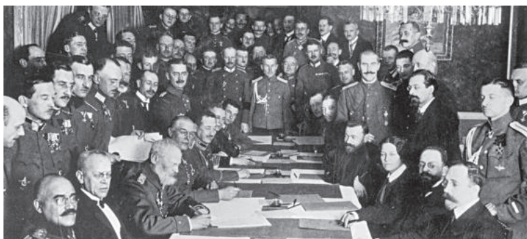
Подписание соглашения о перемирии 15 (28) декабря 1917 года