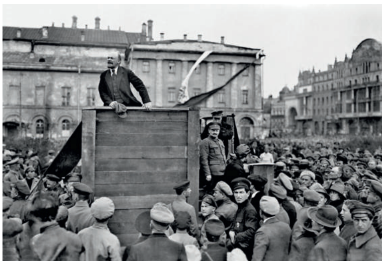
Выступление Ленина в Москве 5 мая 1920 года с призывом к рабочим идти на польский фронт. Справа от трибуны — Л. Троцкий, сзади него — Л. Каменев.