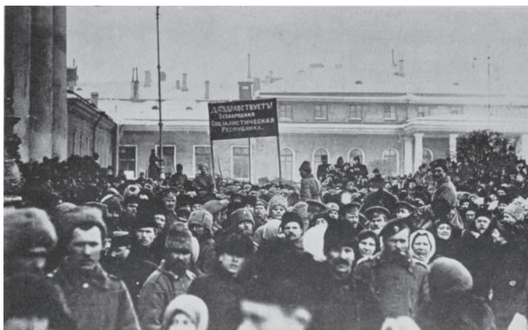
Прореспубликанская демонстрация в Петрограде. Март 1917 года