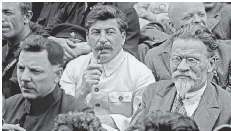
Генеральный секретарь ЦК КПСС И.В. Сталин (в центре), председатель ЦИК Союза ССР М.И. Калинин (справа), нарком по военным и морским делам, председатель РВС СССР К.Е. Ворошилов (слева) среди делегатов XVI съезда ВКП(б) в Москве. 26 июня 1930 года