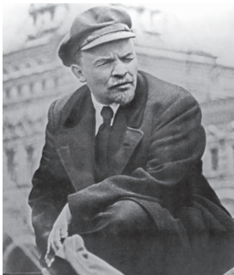
Владимир Ильич Ленин на празднике войск Всеобуча (Всеобщее военное обучение). Первомайская демонстрация. Красная площадь. 1919 год