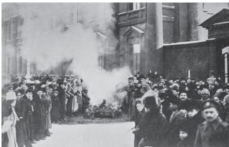
Сожжение государственных гербов и корон у Аничкова моста в Петрограде. 1917 год