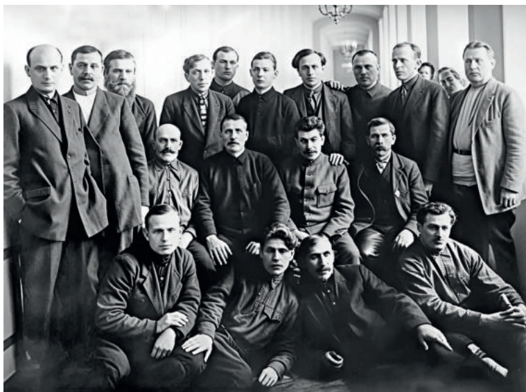
Иосиф Сталин (в центре) и Никита Хрущев (внизу слева) с делегатами XIV съезда Российской коммунистической партии (большевиков). Декабрь 1925 года