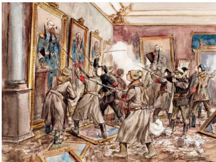
И.А. Владимиров. Вандализм в Зимнем дворце в декабре 1917 года