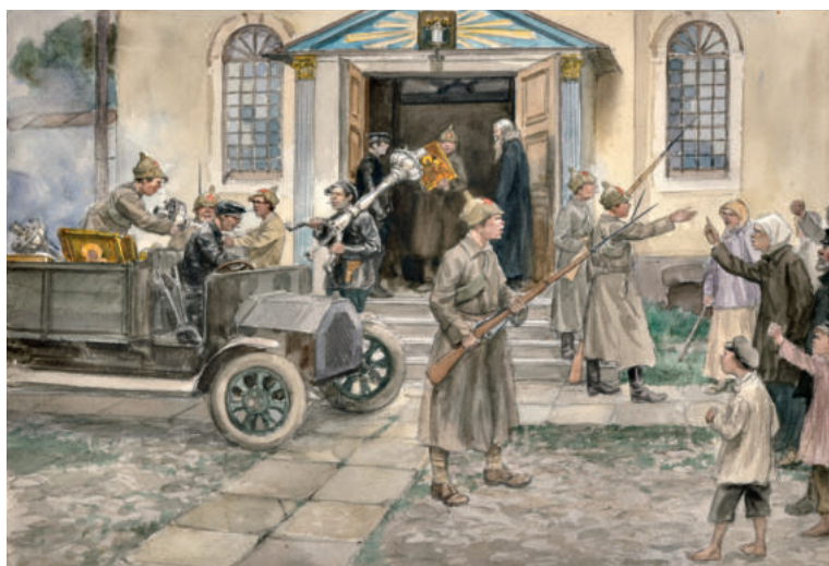
И.А. Владимиров. Реквизиция церковных сокровищ в Петрограде 5 мая 1922 года