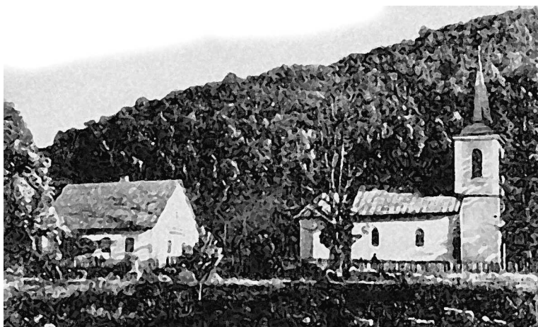
Родительский дом и церковь, в которой служил отец Николы