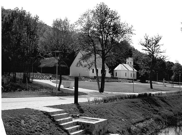
Так выглядит дом-музей Николы Теслы в деревушке Смилян в наши дни