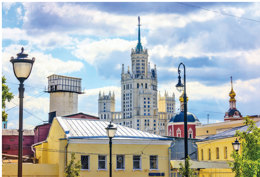
Вид на высотку на Котельнической набережной с Хитровской площади

30 маршрутов в этой книге — это 30 удивительных путешествий по очень непохожим районам Москвы. Громко сказано, но я убеждена в глобальной миссии этой книги и очень надеюсь заложить в душу читателя маленькое зернышко прекрасного. Прорастет ли оно дальше? Не знаю, это дело вкуса, вашего личного жизненного опыта и прочих обстоятельств, но моя задача — делать свою работу так, чтобы зернышко было здоровым, добрым, светлым и настоящим... И я верю, что не только повествую о Москве, а непосредственно ЛЕПЛЮ ее историю!