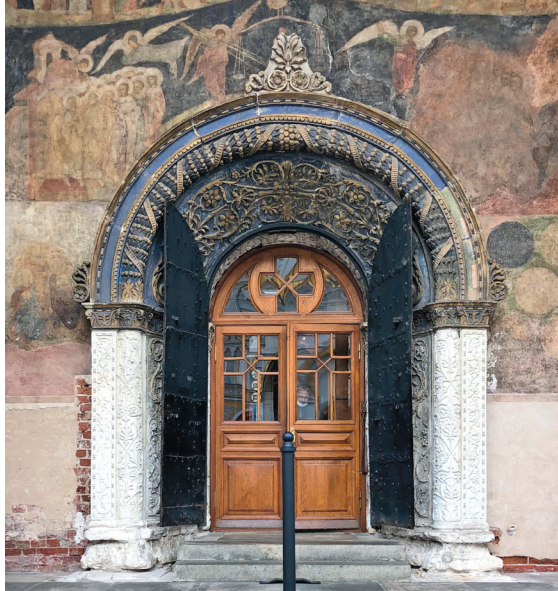
Входная группа Архангельского собора

500 лет, он был построен в 1505–1508 годах. Внутри храма поистине таинственная сакральная обстановка: все пространство под высокими сводами — это большая усыпальница с медными надгробиями русских князей и царей. Всего в усыпальнице 53 захоронения. Двигаясь между надгробий в полумраке и тишине, вчитываясь в имена великих личностей — хорошо знакомых нам