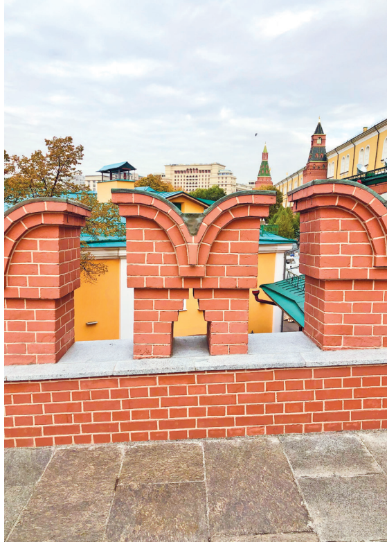
«Ласточкины хвосты» Троицкого моста