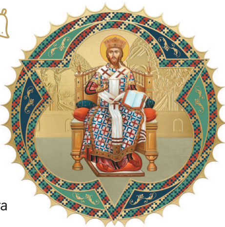
ГОСПОДЬ БОГ — ОСНОВАТЕЛЬ ЦЕРКВИ.