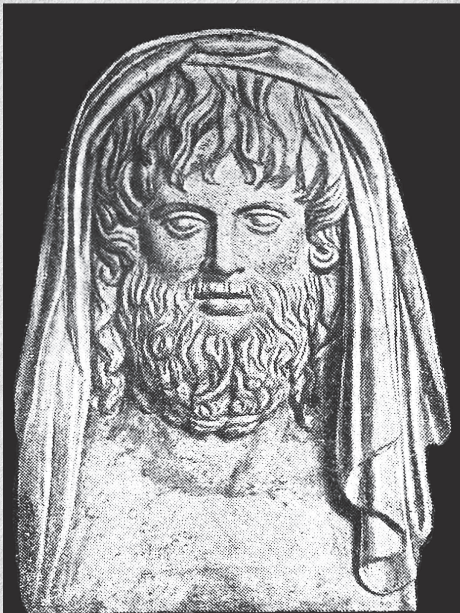
БОГ КРОН — ОТЕЦ БОГА ЗЕВСА. (БЮСТ III В. ДО Н.Э.)