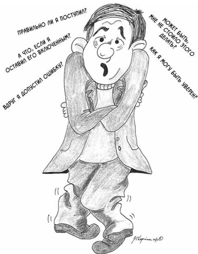
Рис. 1.1. Танец сомнения

Четвертый шаг, знание и действие: профилактика рецидивов , ориентирован на превращение осознания в практическое изменение. Клиент поощряется к действию, основанному на понимании ложной природы сомнений, и учится выявлять и устранять мысли, мешающие ему действовать рационально. Этот раздел посвящен разрыву между знанием, как действовать, и самим действием. Знание подразумевает соответствующее поведение. Это не «прыжок в неизвестность», а естественное продолжение нового мировосприятия. Любая мысль или убеждение, мешающее отказаться от компульсий, анализируются и признаются несостоятельными из-за отсутствия подтверждающей информации в реальности.