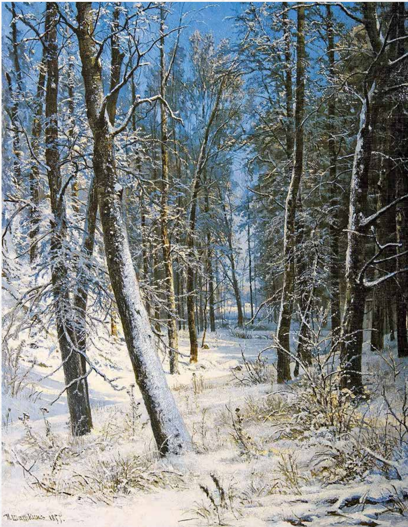
Иван Шишкин. Зима в лесу (Иней), 1877. Киевский национальный музей русского искусства. Киев