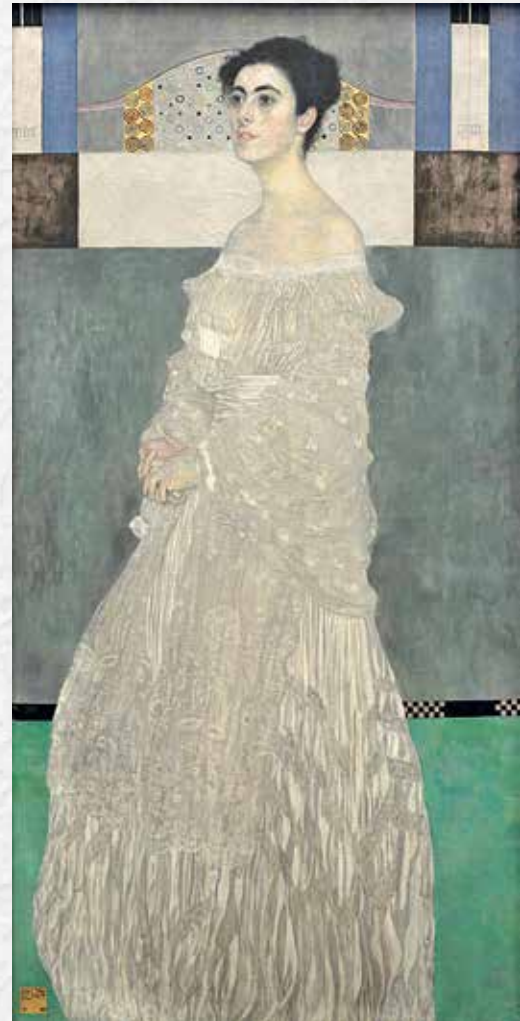
Густав Климт. Портрет Маргариты Стонборо-Витгенштейн, 1905. Новая пинакотeka. Мюнхен