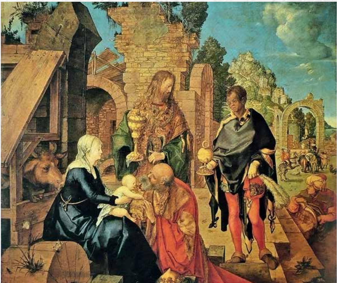
Альбрехт Дюрер. Поклонение волхвов, 1504. Галерея Уффици. Флоренция

ДЮРЕР , Альбрехт ( Dürer ) (1471–1528) — немецкий живописец, рисовальщик и гравёр, крупнейший мастер немецкого Ренессанса. Родился в семье нюрнбергских ювелиров, выходцев из Венгрии. Увлечение рисованием проявилось в раннем детстве, первый наставник — отец. Дядя художника был издателем, что обусловило интерес Альбрехта к гравюре. Важную роль в становлении мастера сыграла поездка в Венецию, где Дюрер познакомился с достижениями итальянского Ренессанса.