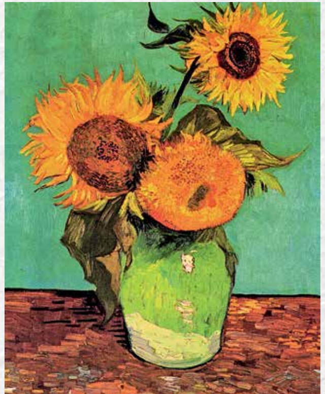
Винсент Ван Гог. Три подсолнуха на бирюзовом фоне, 1888. Частное собрание