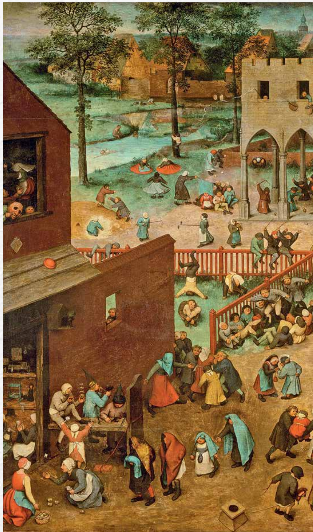
Питер Брейгель. Детские игры, 1560. Музей истории искусств. Вена