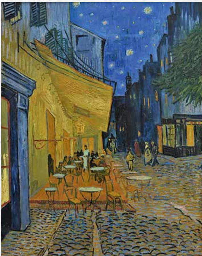
Винсент Ван Гог. Ночная терраса кафе, 1888. Музей Крёллер-Мюллер. Оттерло