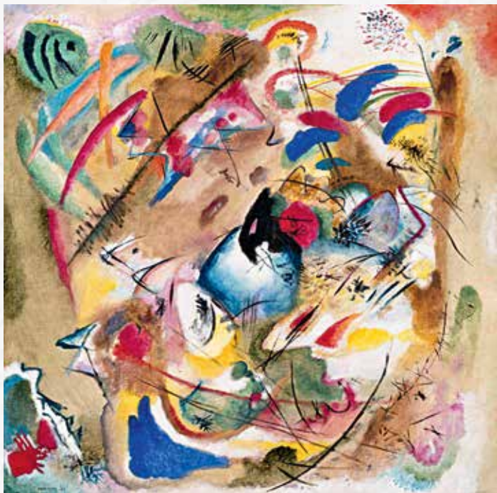
Василий Кандинский. Мечтательное, 1913. Городская галерея в доме Ленбаха. Мюнхен