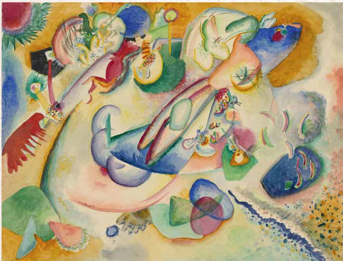
Василий Кандинский. Картина № 199. Импровизация, 1914. Музей современного искусства. Нью-Йорк

АБСТРАКЦИОНИЗМ (от лат. abstractio — «удаление, отвлечение») — беспредметное, нефигуративное искусство; форма изобразительной деятельности, не ставящая своей целью имитацию или отображение визуально воспринимаемой реальности. Абстрактное искусство заменило изображение зримой реальности системой глубоко формальных элементов (линия, плоскость, цветовое пятно, отвлеченная конфигурация). Основоположником абстракции обычно называют Василия Кандинского, который создал первые нефигуративные акварели в 1910 году. Вскоре он написал книгу «О духовном в искусстве», которая обосновывает способность искусства собственными средствами создавать, подобно музыке, новую реальность. Приблизительно в эти же годы к беспредметному искусству приходят несколько живописцев: Робер Делоне, Франтишек Купка, Пауль Клее, Франц Марк, Михаил Ларионов, Алексей Явленский. Последователей эмоционального и живописного направления Кандинского стали называть лирическими абстракционистами.