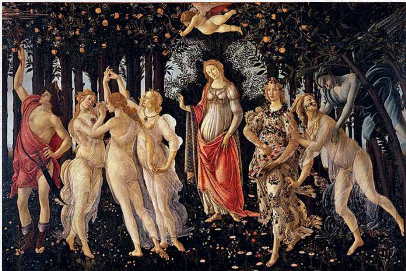
Сандро Боттичелли. Весна, ок. 1480. Галерея Уффици. Флоренция

С приходом к власти во Флоренции монаха Джироламо Савонаролы характер творчества Боттичелли поменялся: его поздние картины наполнены пессимизмом и тоской, что проявляется в интенсивности красок, ломкости линий и напряженности композиций: «Клевета» (1495, Галерея Уффици, Флоренция); «Покинутая» (1495, Галерея Паллавичини, Рим); «Пьета» (1492, Старая пинакотека, Мюнхен). Лиричное и возвышенное искусство художника стало одной из вершин эпохи Кватроченто.