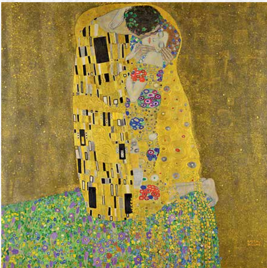
Густав Климт. Поцелуй, 1908–1909. Галерея Бельведер. Вена