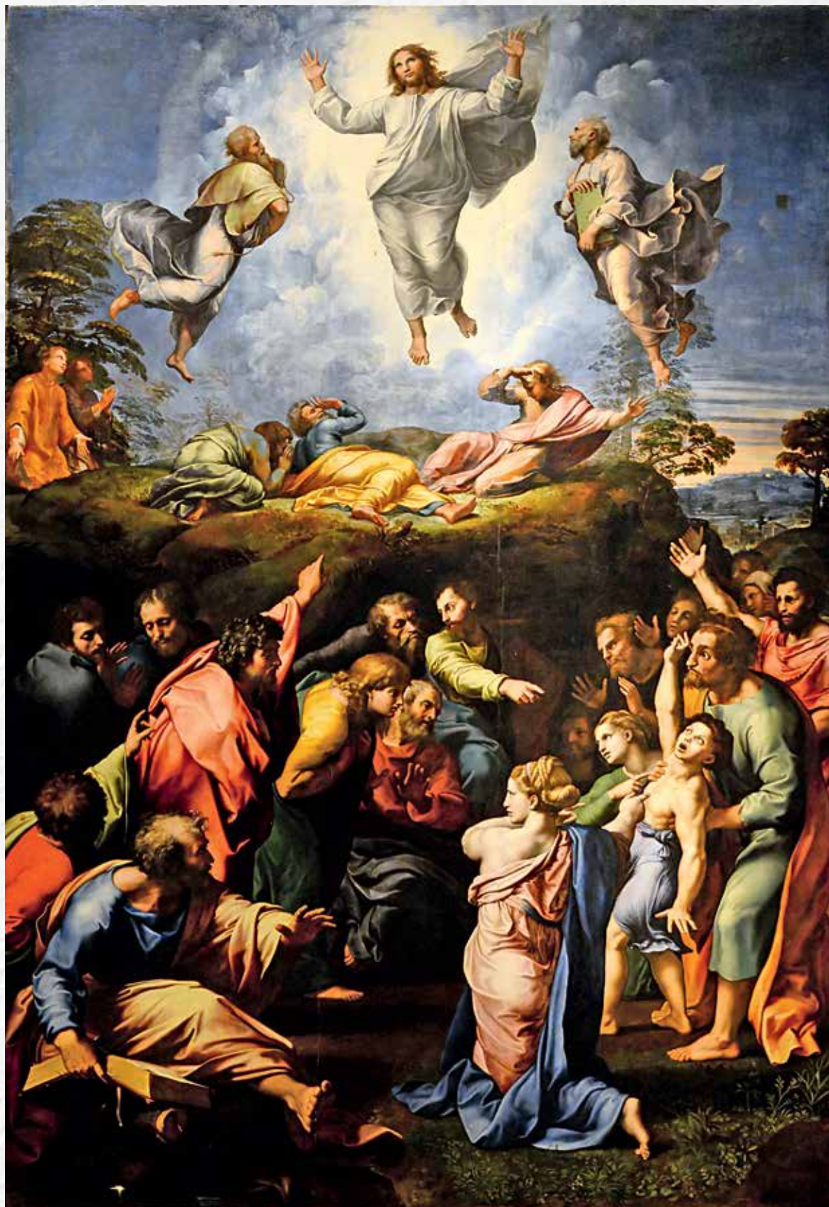
Рафаэль. Преображение, 1520. Ватиканская пинотека. Ватикан