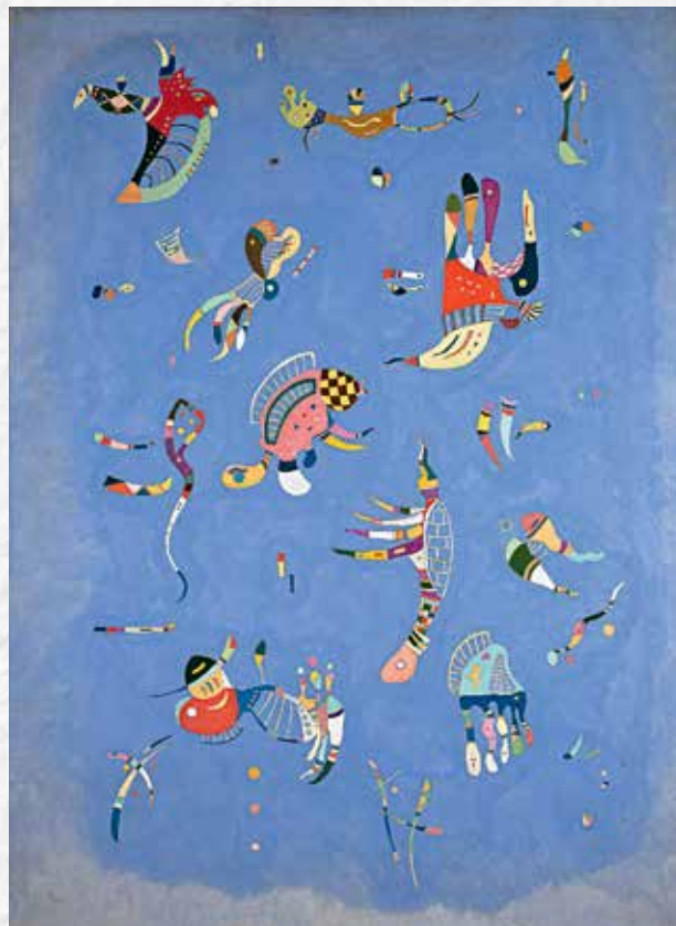
Василий Кандинский. Небесно-голубой, 1940. Центр Помпиду. Париж