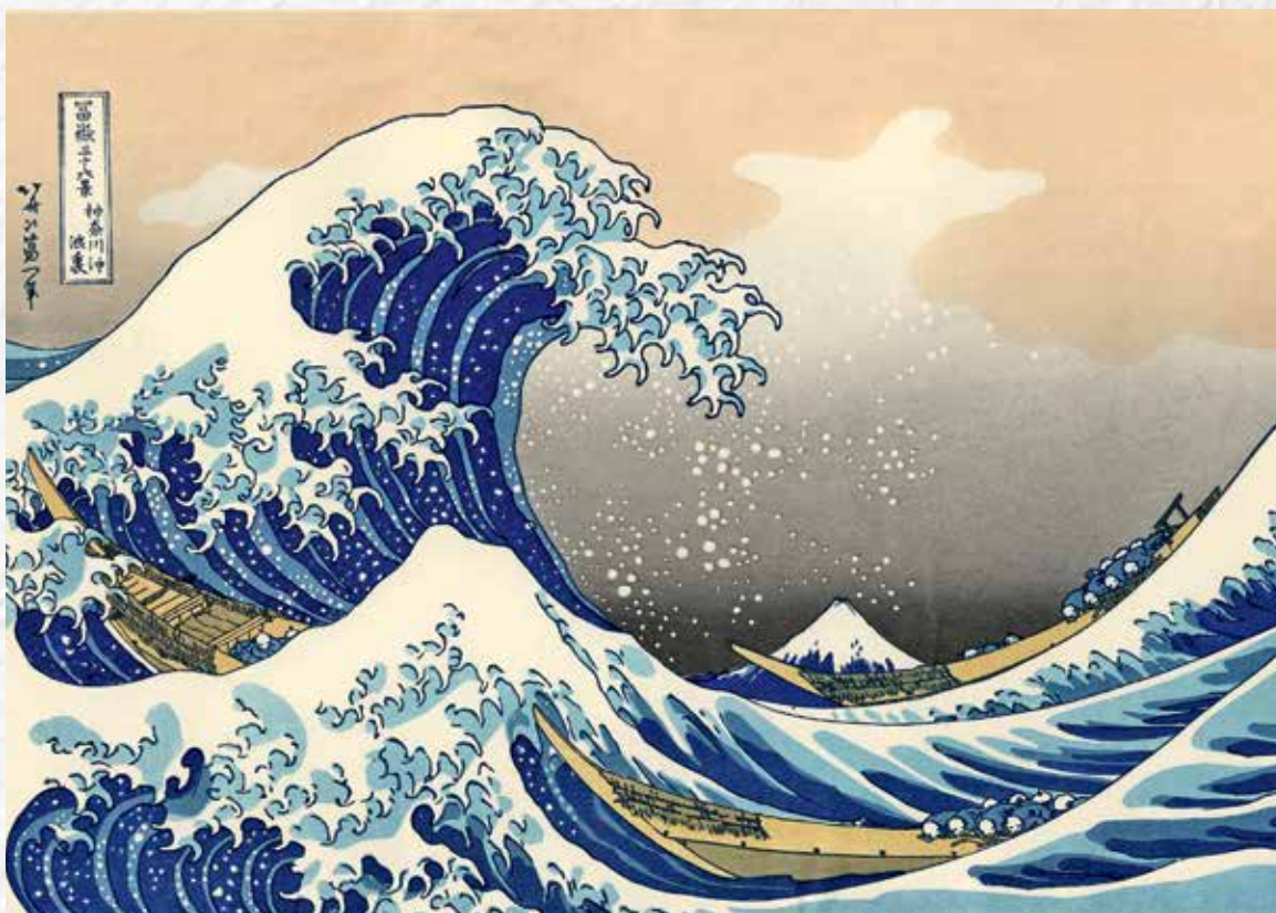
Кацусика Хокусай. Большая волна в Канагаве из серии «Тридцать шесть видов Фудзи», 1830

Высочайший художественный уровень произведений Хокусая принес ему славу самого известного художника Японии, его искусство оказало колоссальное воздействие на западную живопись.