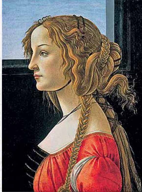
Сандро Боттичелли. Портрет молодой женщины, 1476–1480. Картинная галерея. Берлин

Самые знаменитые работы Боттичелли написал, сблизившись с кругом поэтов и мыслителей, лидером которых был правитель Флоренции Лоренцо Великолепный. Теперь все чаще художника привлекают персонажи из античных мифов, которые в его произведениях приобретают созерцатель-