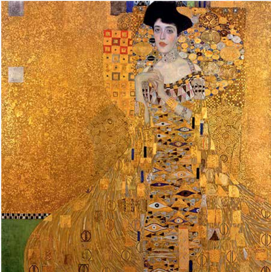
Густав Климт. Портрет Адели Блох-Бауэр I, 1907. Новая галерея. Нью-Йорк