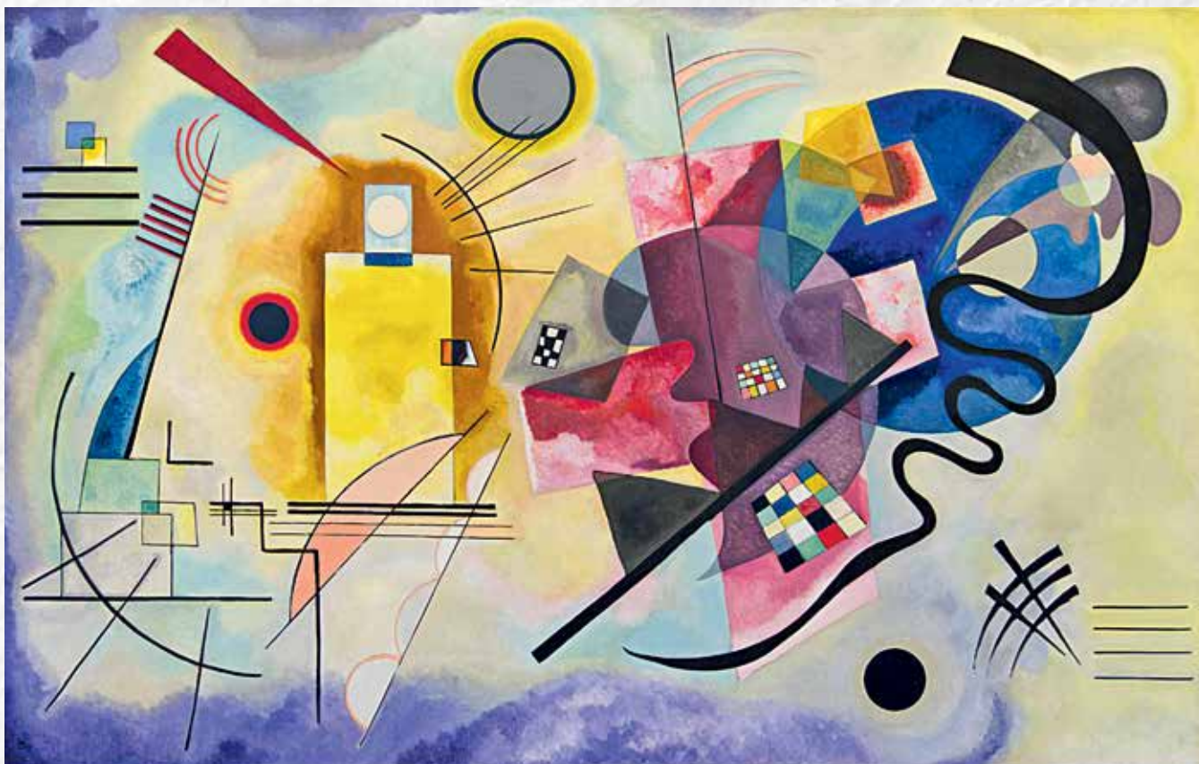
Василий Кандинский. Желтое-красное-синее, 1925. Центр Помпиду. Париж