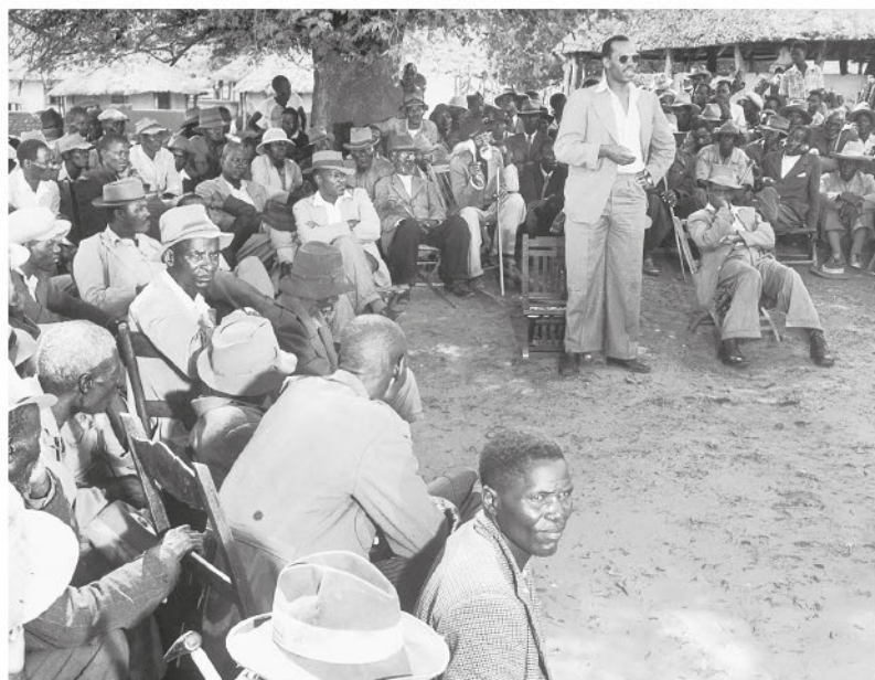
Рисунок 5. Серетсе Кхама обращается к суду племени в Серове, 1949 г.

Соединенного Королевства, а теперь, по причине этого брака, бывшая сотрудница Лондонского Ллойда 1 . Ее уволили сразу после того, как общественность узнала о ее замужестве [2].