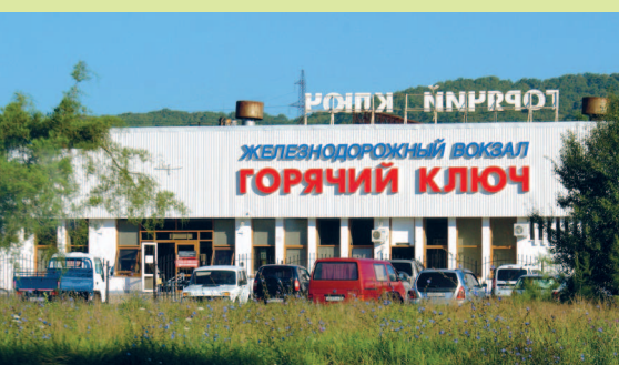
Железнодорожный вокзал в Горячем Ключе

П редгорья Северного Кавказа — обширный природный регион, прилегающий к северному макросклону Большого Кавказа и расположенный преимущественно в Краснодарском крае, Адыгее и Ставропольском крае.