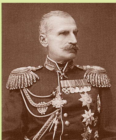
Ф. Н. Сумароков-Эльстон (1820–1877), генерал-адъютант, генерал-лейтенант. Наказной атаман Кубанского Казачьего войска и начальник Кубанской области, командовавший расположенными в ней войсками с 23 марта 1863 г. по 3 февраля 1869 г.