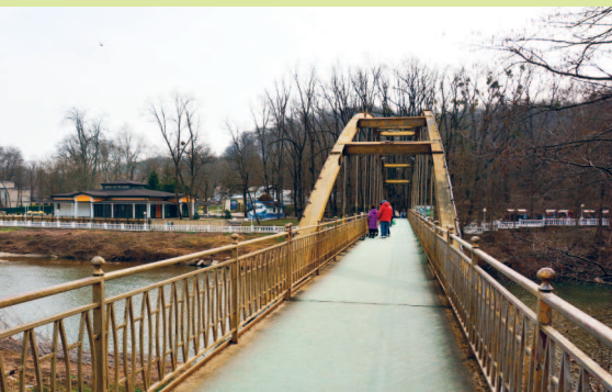
Подвесной Счастливый мост через реку Псекупс