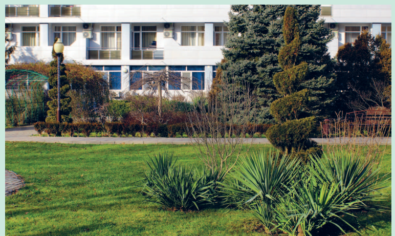
Горячий Ключ зимой.