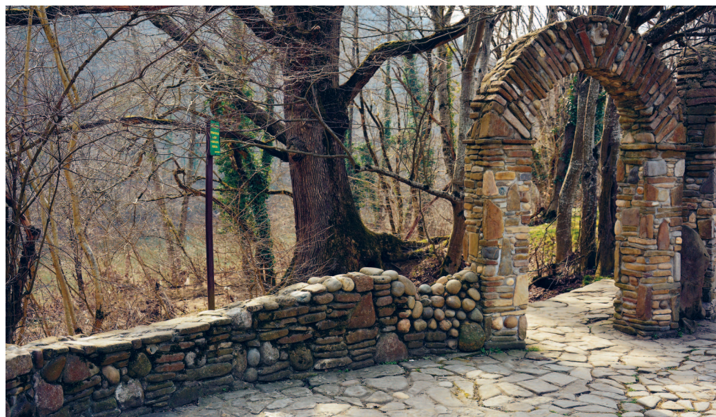
Набережная реки Псекупс

В Горячем Ключе надо обязательно загадать желание на Счастливом мосту, попробовать минеральные воды из нескольких источников, побывать в Дантовом ущелье, подняться на скалу Петушок (она же Спасения), прокатиться на канатной дороге и колесе обозрения, покататься по реке Псекупс на лодке.