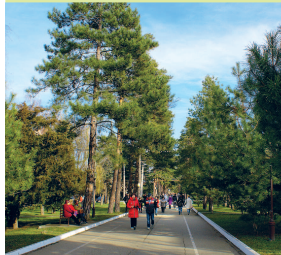
Аллея Тысячи Сосен зимой