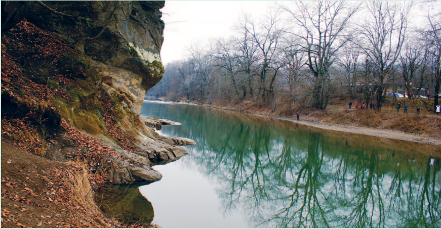
В районе Абадзехской горы ширина реки Псекупс едва достигает 50 метров.

Воды реки Псекупс имеют различный цвет и прозрачность на протяжении всего течения. В верховьях они абсолютно прозрачные, а в нижнем течении, на равнине, приобретают мутность и коричневатый цвет из-за илистого грунта. Там же, где река протекает мимо сероводородных источников, вода имеет голубовато-зеленый цвет.