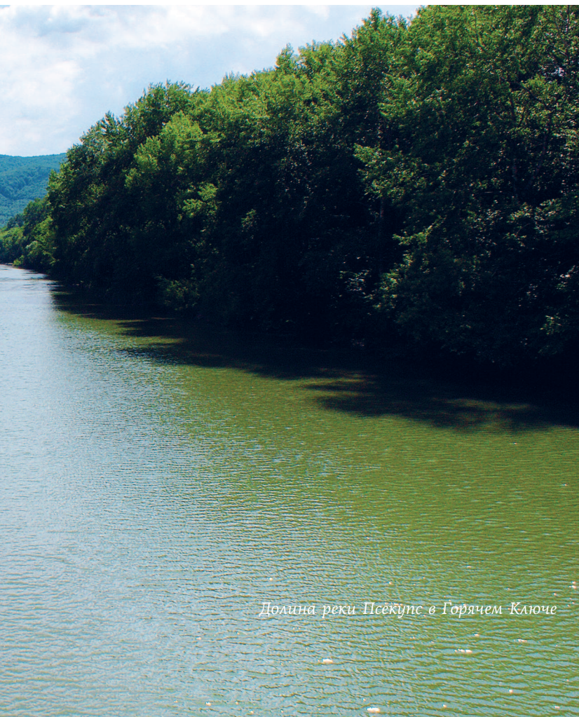
Долина реки Псекупс в Горячем Ключе