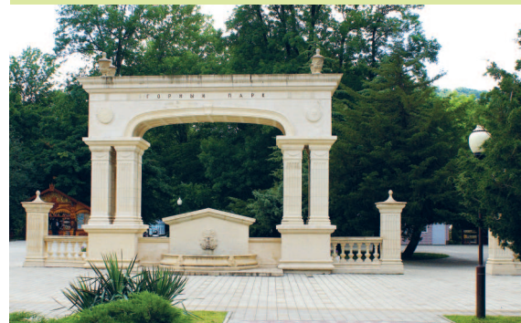
Вход в Горный парк со стороны улицы Ленина