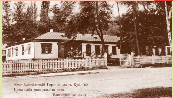
М-ко Алексеевский Горячий ключъ Куб. Обл. Псекупскія минеральныя воды. Войсковая больница. Войсковая больница в местечке Алексеевский Горячий Ключ. Дореволюционная открытка

Курорт имеет наибольшую популярность у тех, кто любит совмещать активный отдых с оздоровлением организма. Здесь можно принять сероводородные ванны, испить целебной минеральной воды, а затем, укрепив здоровье, отправиться гулять по красивым природным местам, которых столь много в окрестностях.