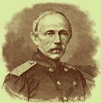
Г. В. Новицкий, генерал от артиллерии (1800–1877). Ксилография. 1877 г. Приложение к «Русской старине». Издательство 1978 г., Санкт-Петербург