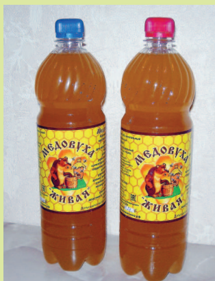
Медовуха, производимая в Горячем Ключе

Помимо популярных у туристов магнитиков на холодильник и прочих традиционных сувениров, отсюда можно привезти: местную минеральную воду, поильники для минеральной воды (специальные кружки с носиком для питья минералки), горные травы, горный мед, медовуху, которую делают на местных пасеках.