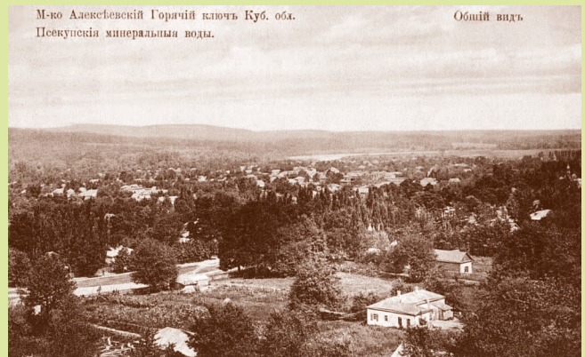
М-ко Алексеевский Горячий ключъ Куб. обл. Псекупскія минеральныя воды. Общий видъ Местечко Алексеевский Горячий Ключ. Дореволюционная открытка