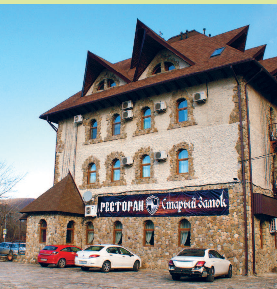
Гостинично-ресторанный комплекс «Старый Замок»