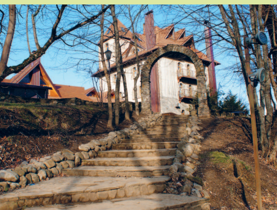
Спуск от набережной на левом берегу к реке Псекупс