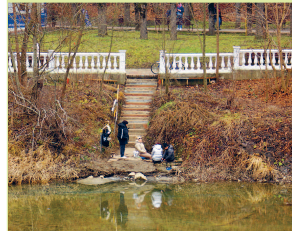
Сероводородный источник на реке Псекупс у моста. Координаты сероводородного источника: 44.623473, 39.092554