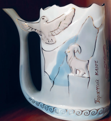
Кружка для питья минеральной воды