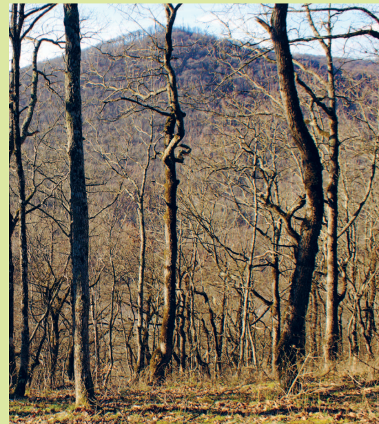
Вид на хребет Пшаф от хребта Котх

Согласно топонимическому словарю местного краеведа А. В. Твердого, название хребта Котх переводится с адыгейского как «кабаний хребет» («къо» — «свинья», а «тхы» — «хребет», «спина»). Раньше на хребте водилось много диких кабанов.