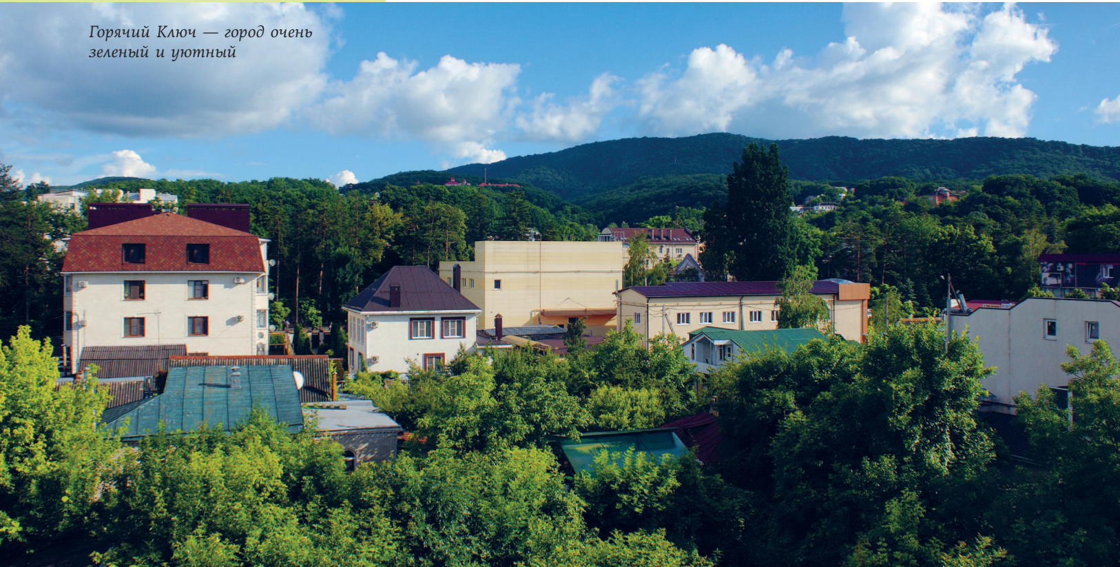
Горячий Ключ — город очень зеленый и уютный

В путеводителе описаны самые популярные и красивые места, до которых несложно добраться.