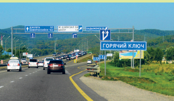
Трасса М-4 «Дон» возле Горячего Ключа