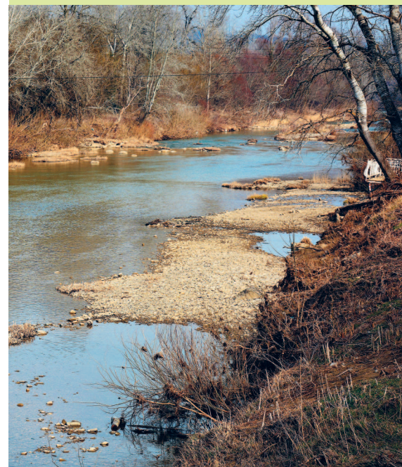
Иногда Псекупс мелеет