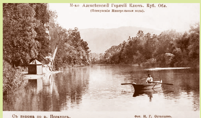
М-ко Алексеевский Горячий Ключъ, Куб. Обл. (Псекупскія минеральныя воды). Съ парома по р. Псекупъ. На реке Псекупс в местечке Алексеевский Горячий Ключ. Дореволюционная открытка