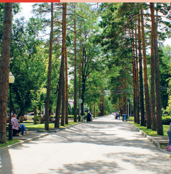
Аллея Тысячи Сосен