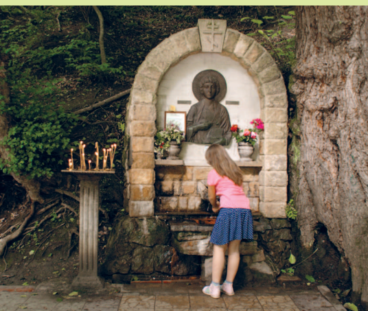
Источник Святого Пантелеймона в Горячем Ключе

Попробовать минеральные воды из нескольких источников, в том числе и свя- тую воду целителя Пантелеймона.