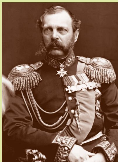
Император Александр II (1818–1881)

Город Горячий Ключ основан на месте адыгского селения Псыфабэ (в переводе — «горячая вода»). Уже в те годы адыги знали о лечебных свойствах воды источников и активно использовали ее для укрепления здоровья.