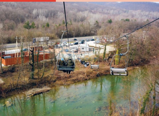
Над рекой проходит канатная дорога