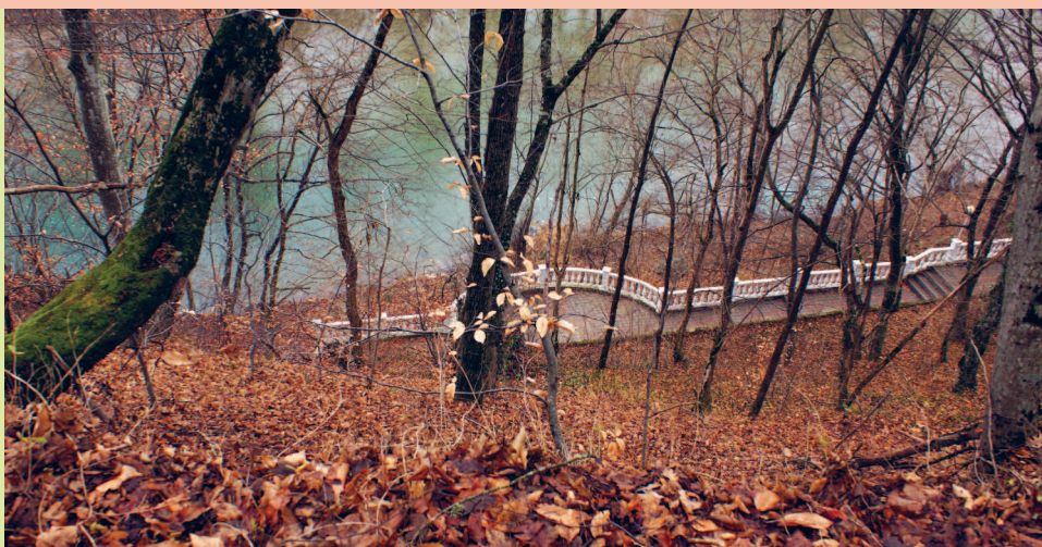
В Горячем Ключе осенью

Часть природных мест (Целебный парк, Дантово ущелье, река Псекупс и горные тропы лесопарка) расположены прямо на территории города.