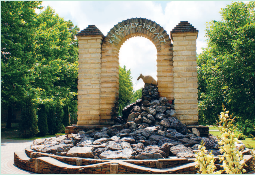
Начало курорту Горячий Ключ положили минеральные источники