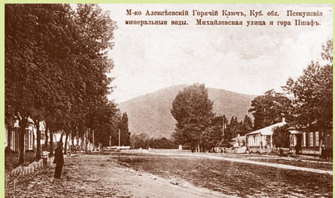
М-ко Алексеевский Горячий Ключъ, Куб. обл. Псекупскія минеральныя воды. Михайловская улица и гора Пшафъ. Михайловская улица в местечке Алексеевский Горячий Ключ. Дореволюционная открытка