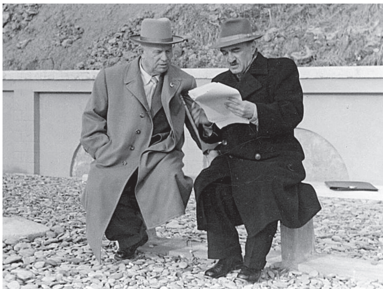
Никита Хрущев и Анастас Микоян

ществование социалистической Кубы. Если бы Куба не прошла через такой кризис, то маловероятно, чтобы американцы не организовали нового вторжения для ликвидации социалистического строя. А сейчас США сделать это очень трудно. Пронесся сильный накал страстей, мы обменялись обязательствами, и вдруг после этого Америка вторгается? В этом случае у Советского Союза остается право напасть в ответ на США. Так там и было написано. Поэтому Кеннеди не пойдет на это. Сейчас мы добились существования социалистической Кубы еще на следующие два года, пока Кеннеди сидит в Белом доме. Но у нас складывается мнение, что Кеннеди будет избран и на второй срок. Следовательно, это еще четыре года. Итого: шесть лет. Шесть лет прожить в наше время — немалый срок. Тогда уже сложится иное соотношение сил. Оно все больше меняется в пользу социализма.