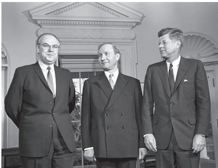
Анатолий Добрынин. Встреча с президентом Кеннеди

После провала интервенции на Кубе в апреле 1961 года, предпринятой кубинскими контрреволюционерами, США продолжали оказывать всесторонний нажим на Кубу. В январе 1962 года они добились исключения Кубы из Организации американских государств и прибегли к экономической блокаде.