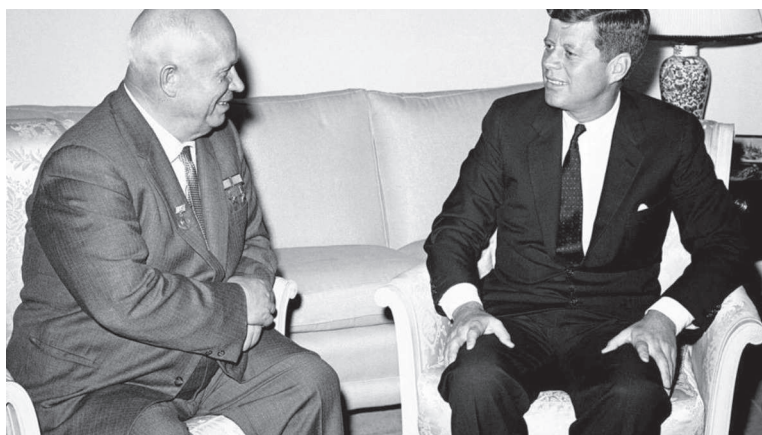
Никита Хрущев и Джон Кеннеди. Попытка найти общий язык

стров СССР, в то время — несомненный лидер Советского Союза. В близком окружении он говаривал, что «надо засунуть американцам ежа в штаны». К тому же, Хрущев, любивший отдыхать под Ялтой, часто сетовал, что напротив — турецкие берега, а там — американские заряды, нацеленные на Советский Союз. 15 ракет средней дальности «Юпитер», которые могли достичь Москвы... Изменить эту ситуацию можно было только нестандартными и резкими решениями. Кремль воспользовался тем, что американцы определенно недооценили ни кубинскую революцию, ни пруть советской дипломатии, которая сумела наладить союзнические отношения с легендарными барбудос — Фиделем Кастро и Че Геварой. Советский Союз получил «непотопляемый авианосец» в 180 километрах от Штатов.