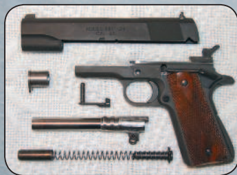
Основные детали (неполная разборка) пистолета M1911.

Пистолет M1911 состоял из трех крупных частей (рамки, ствола и кожуха-затвора) и 53 более мелких деталей. Автоматика работала за счет отдачи при коротком ходе ствола. Однако в отличие от всех предыдущих моделей ствол M1911 был соединен с рамкой пистолета при помощи только одной (качающейся) серьги, расположенной под казенной частью ствола. После выстрела ствол, сцепленный с затвором, двигался назад. При этом серьга поворачивалась на подствольной оси, и казенная часть ствола опускалась. Ствол останавливался, а затвор, продолжая движение назад, выбрасывал использованную гильзу, взводил курок и сжимал возвратную и боевую пружины. Кстати, конструктор нашел для этих пружин очень удачное месторасположение, разместив возвратную пружину под стволом, а боевую — в рукоятке, позади магазина.