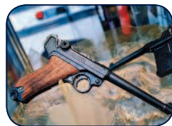
LP-08 — так называемая артиллерийская модель.

Артиллерийский «Парабеллум» имел общую длину 327 мм (длину ствола 200 мм), вес без патронов 1000 г и начальную скорость пули 370 м/с. Он предназначался для вооружения расчетов орудий и младших офицеров пулеметных команд. LP-08 с приставной деревянной кобурой-прикладом позволял вести прицельный огонь на расстояние до 800 м. Емкость магазина была стандартной — восемь патронов, но мог применяться и дисковый магазин системы Леера емкостью 32 патрона.