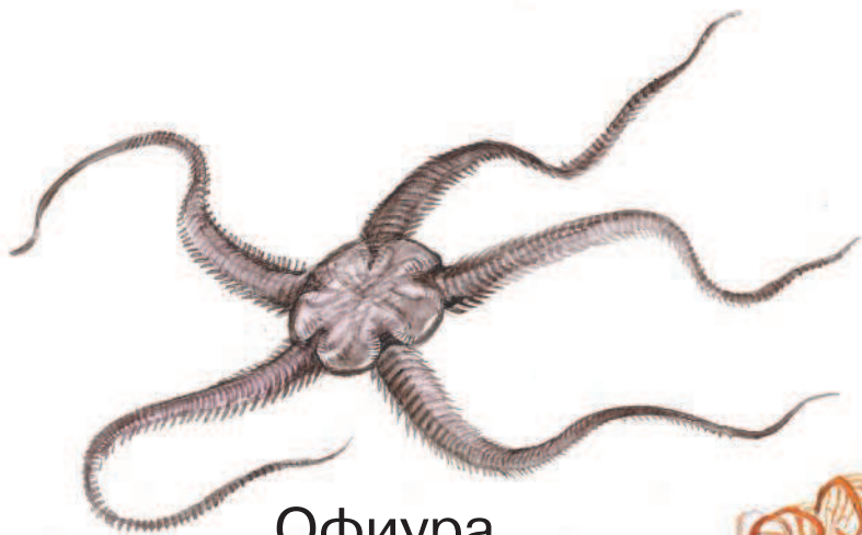
Офиура, или змеехвостка