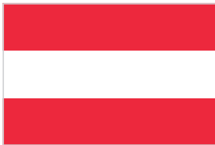
ФЛАГ АВСТРИЙСКОЙ РЕСПУБЛИКИ, ОБЫЧНО ИСПОЛЬЗУЮЩИЙСЯ КАК ГРАЖДАНСКИЙ

Понятие «гражданский флаг» сложилось поздно. В большинстве случаев так называют флаг, обозначающий государственную принадлежность и используемый на суше частными лицами: гражданский флаг можно вывесить на крыше, на флагштоке (если, конечно, в законодательстве конкретного государства нет особых условий относительно государственной символики). Иногда гражданский флаг отличается от государственного — как, например, в Австрии, где для вывешивания на государственных учреждениях предназначен вариант с гербом, а для частного использования — без герба, просто полотнище с одной горизонтальной белой полосой в центре и двумя красными по краям.