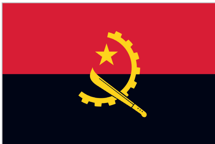
ФЛАГ РЕСПУБЛИКИ АНГОЛА

ОФИЦИАЛЬНОЕ НАЗВАНИЕ – РЕСПУБЛИКА АНГОЛА В 1975 ГОДУ ПОЛУЧИЛА НЕЗАВИСИМОСТЬ ОТ ПОРТУГАЛИИ ФОРМА ПРАВЛЕНИЯ – ПРЕЗИДЕНТСКАЯ РЕСПУБЛИКА НАСЕЛЕНИЕ – ОКОЛО 29 310 300 ЧЕЛОВЕК СТОЛИЦА – ЛУАНДА