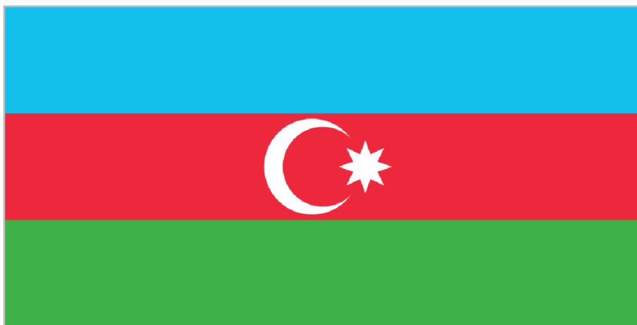
ФЛАГ АЗЕРБАЙДЖАНСКОЙ РЕСПУБЛИКИ