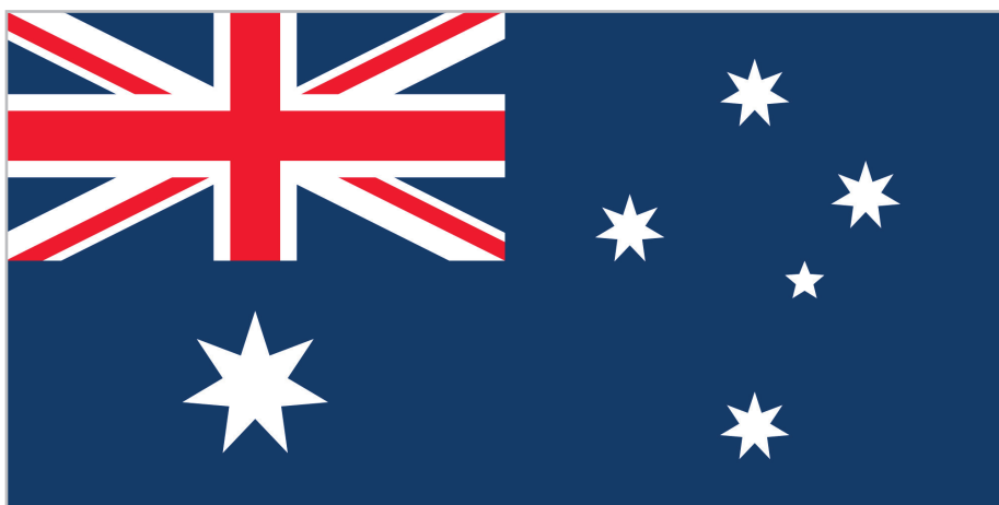
СОВРЕМЕННЫЙ ФЛАГ АВСТРАЛИЙСКОГО СОЮЗА

ОФИЦИАЛЬНОЕ НАЗВАНИЕ – АВСТРАЛИЙСКИЙ СОЮЗ В 1986 ГОДУ «АКТом АВСТРАЛИИ» БЫЛА ЗАКРЕПЛЕНА ФАКТИЧЕСКАЯ НЕЗАВИСИМОСТЬ ОТ ВЕЛИКОБРИТАНИИ С СОХРАНЕНИЕМ ОБЩЕГО ГЛАВЫ ГОСУДАРСТВА ФОРМА ПРАВЛЕНИЯ – КОНСТИТУЦИОННАЯ МОНАРХИЯ НАСЕЛЕНИЕ – ОКОЛО 25180 000 ЧЕЛОВЕК СТОЛИЦА – КАНБЕРРА