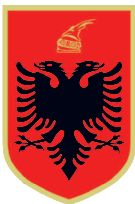
..... СОВРЕМЕННЫЙ ГЕРБ АЛБАНИИ С ИЗОБРАЖЕНИЕМ ШЛЕМА СКАНДЕРБЕГА .....

Двуглавый орел на албанском флаге напоминает о том, что согласно древней легенде, албанцы являются потомками орлов (сами они называют свою страну «Shqipëria» — «Шкиперия», то есть «земля орлов», «орлиная страна». Название «Албания» было дано скорее всего римлянами по наименованию одного из местных племен).