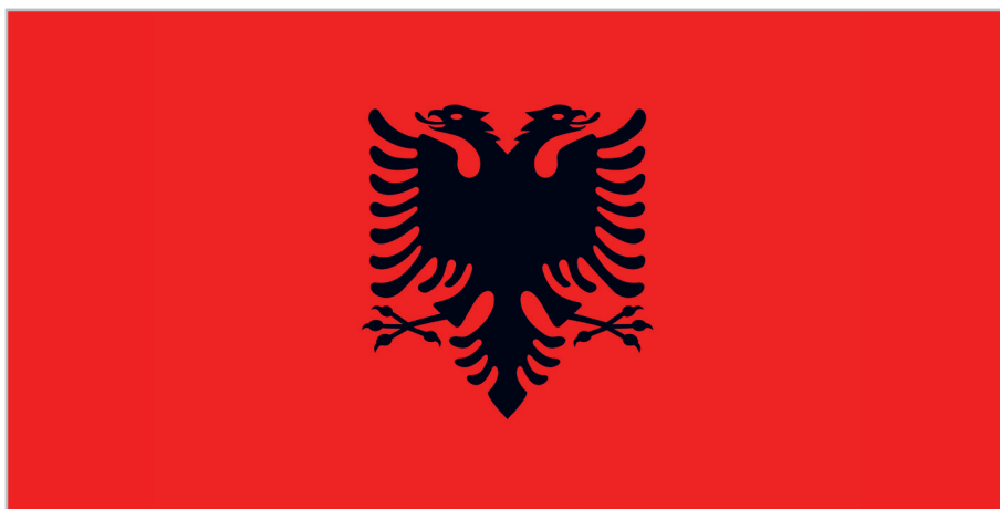
СОВРЕМЕННЫЙ ФЛАГ РЕСПУБЛИКИ АЛБАНИЯ, УТВЕРЖДЕННЫЙ В 1992 ГОДУ

ОФИЦИАЛЬНОЕ НАЗВАНИЕ – РЕСПУБЛИКА АЛБАНИЯ В 1912 ГОДУ АЛБАНИЯ СТАЛА НЕЗАВИСИМА ОТ ОСМАНСКОЙ ИМПЕРИИ ФОРМА ПРАВЛЕНИЯ – ПАРЛАМЕНТСКАЯ РЕСПУБЛИКА НАСЕЛЕНИЕ – ОКОЛО 2 877 000 ЧЕЛОВЕК СТОЛИЦА – ТИРАНА