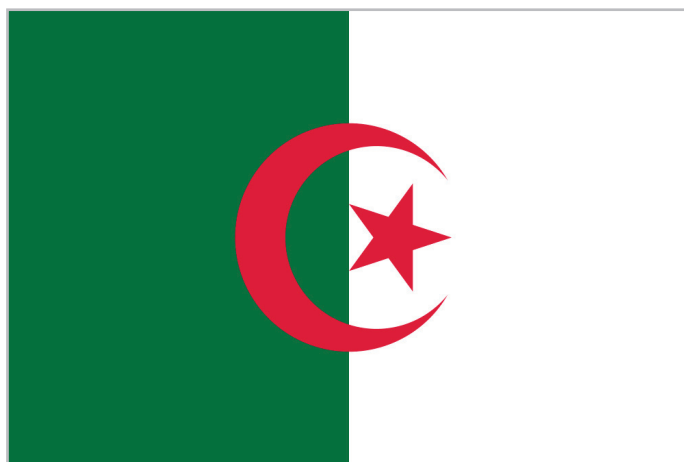
ФЛАГ АЛЖИРСКОЙ НАРОДНОЙ ДЕМОКРАТИЧЕСКОЙ РЕСПУБЛИКИ