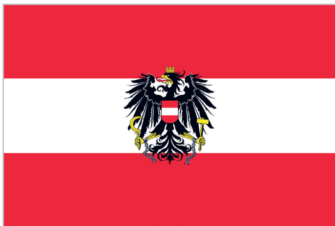
ФЛАГ АВСТРИЙСКОЙ РЕСПУБЛИКИ, ИСПОЛЗУЮЩИЙСЯ ГОСУДАРСТВЕННЫМИ УЧРЕЖДЕНИЯМИ

ОФИЦИАЛЬНОЕ НАЗВАНИЕ – АВСТРИЙСКАЯ РЕСПУБЛИКА ОКТАБРЬ 1919 ГОДА – ГЕРМАНСКАЯ АВСТРИЯ, ОБРАЗОВАВШАЯСЯ В ХОДЕ РАСПАДА АВСТРО-ВЕНГРИИ, БЫЛА ПРЕОБРАЗОВАНА В РЕСПУБЛИКУ АВСТРИЯ ФОРМА ПРАВЛЕНИЯ – ФЕДЕРАТИВНАЯ ПАРЛАМЕНТСКАЯ РЕСПУБЛИКА НАСЕЛЕНИЕ – ОКОЛО 8 923 500 ЧЕЛОВЕК СТОЛИЦА – ВЕНА