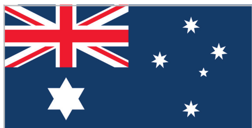
РАННИЙ ВАРИАНТ ФЛАГА АВСТРАЛИЙСКОГО СОЮЗА

Официально Австралия именуется «Австралийский Союз» или «Содружество Австралии», а возглавляется королевой Великобритании. Правда, принятым в 1986 году «Актом Австралии» главенство британского парламента над местными органами власти было упразднено. После того как далекий континент был открыт европейцами, долгое время он именовался «Terra Australis Incognita» — «Неведомая южная земля». Систематическое освоение «неведомой земли» начали лишь во второй половине XVIII века, а в 1824 году название «Австралия» стало официальным. В конце XIX столетия была составлена и вскоре ратифицирована первая австралийская конституция, которая сохраняла за британским правительством руководящие функции в отношении Австралии. А в 1901 году шесть австралийских штатов (фактически это были британские колонии — Новый Южный Уэльс, Виктория, Квинсленд, Южная Австралия, Западная Австралия, Тасмания) создали