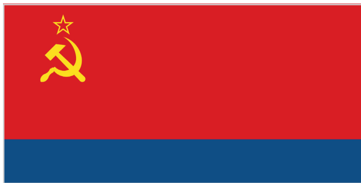
ФЛАГ АЗЕРБАЙДЖАНСКОЙ ССР