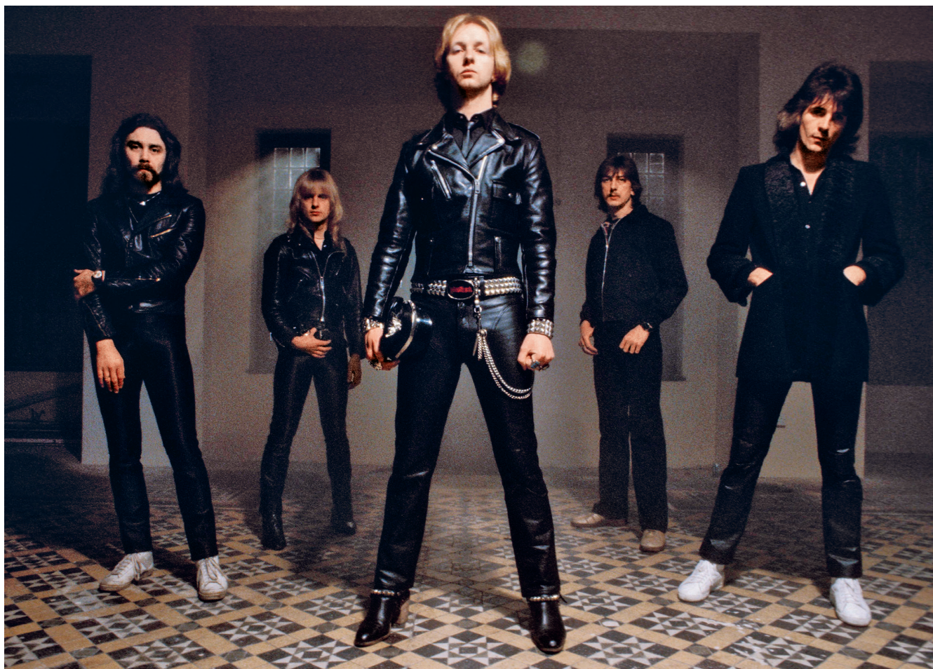
Ян Хилл, К. К. Даунинг, Роб Хэлфорд, Дэйв Холланд и Гленн Типтон из Judas Priest, группы, ставшей символом британской хеви-метал-сцены 1970-х и лидерами Новой волны британского хеви-метала.

оказывают сильное влияние Diamond Head, Tygers of Pan Tang и Iron Maiden — новая британская группа, только что выпустившая второй альбом, Killers .