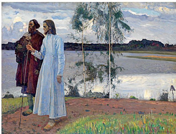
Михаил Нестеров. Путники. За Волгой. 1922. Частное собрание

русского народа, и яркие жанровые картины Бориса Кустодиева.