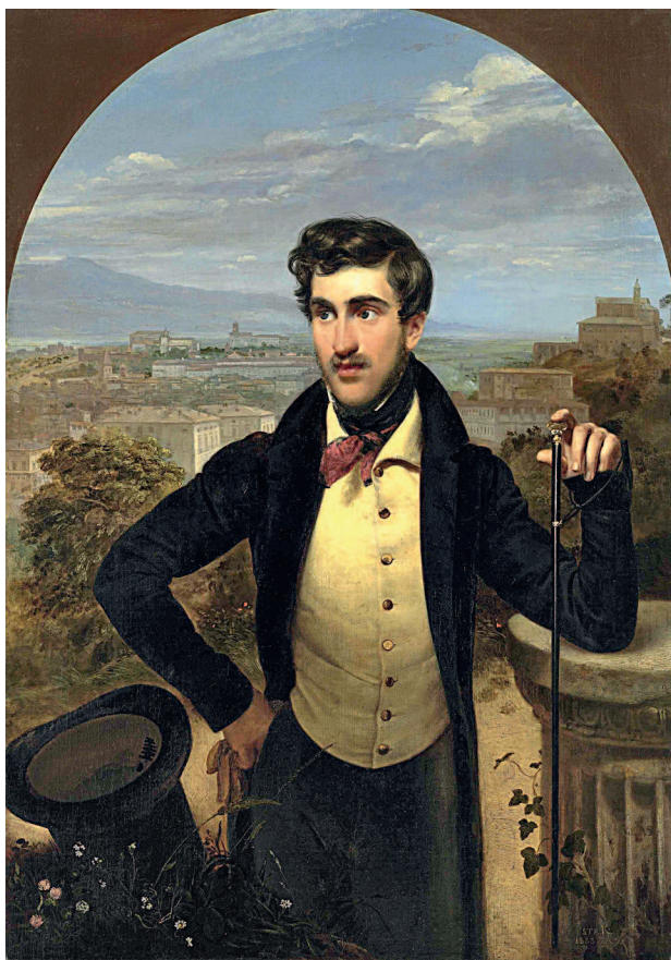
Орест Кипренский. Портрет князя М. А. Голицына. 1833. Частное собрание