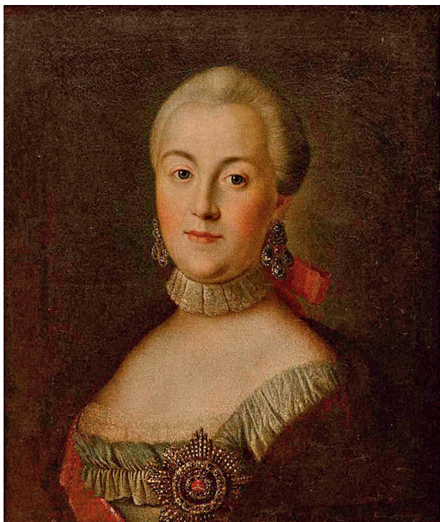
Алексей Антропов. Великая княгиня Екатерина Алексеевна, будущая Екатерина II. До 1762. Местонахождение неизвестно

ный синтез восточных и западных традиций, создав особый русский стиль, сочетающий сакральное и светское.