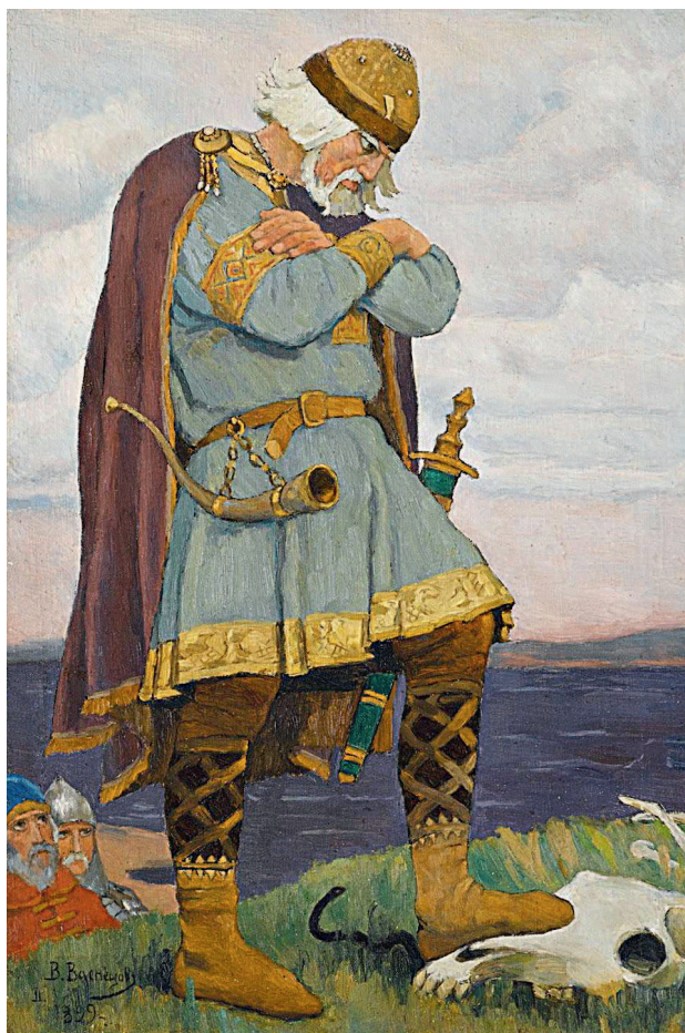
Виктор Васнецов. Вещий Олег. 1899. Частное собрание