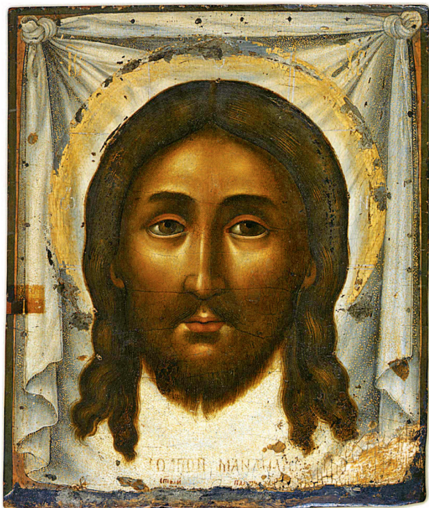
Симон Ушаков. Спас Нерукотворный. 1670-е. Частное собрание

искусстве. Европейские влияния, связанные с Ренессансом и барокко, привнесли элементы натурализма, перспективы и кьяроскуро в русское искусство, способствуя развитию портрета, натюрморта и пейзажа. Таким образом, русские художники создали уникаль-