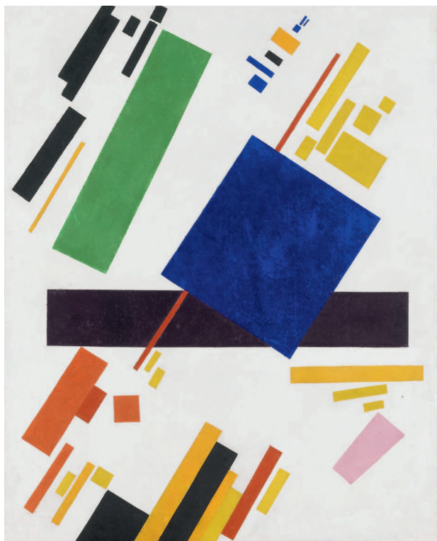
Казимир Малевич. Супрематическая композиция. 1916. Частное собрание