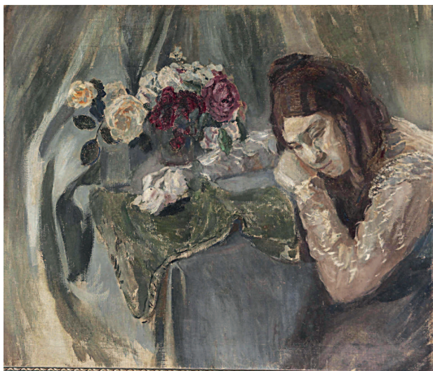
Виктор Борисов-Мусатов. Девушка с розами. Портрет сестры. 1902. Государственный музей искусств Казахстана имени А. Кастеева, Алма-Ата

и парадные портреты знати, и камерные, интимные женские изображения кисти Владимира Боровиковского, и романтические портреты Ореста Кипренского, реалистичные и сентиментальные пейзажи Ивана Шишкина, Исаака Левитана, Алексея Саврасова, а также исторические полотна Василия Сурикова и Ильи Репина, марины Ивана Айвазовского, динамичные батальные сцены Василия Верещагина. Это остросюжетные бытовые сцены Константина Маковского, посвященные простым сюжетам из жизни