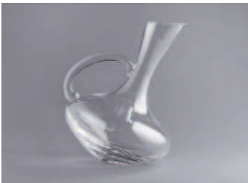
Фотографии сверху вниз, слева направо: ручник, раскладка, декантер, сомелье