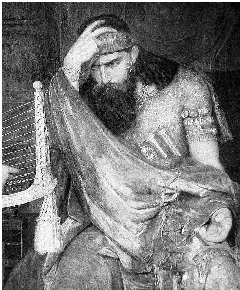
Эрнст Йосефсон. Саул внимлет музыке Давида. Фрагмент