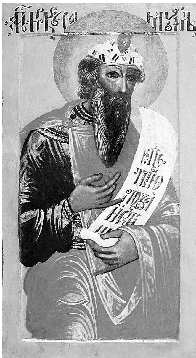
Пророк Самуил. Икона XVII века. Русский Север. Донецкий областной художественный музей