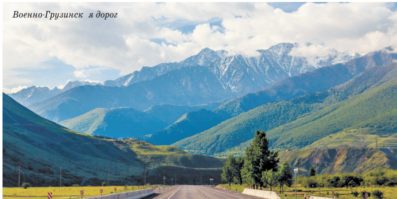
Военно-Грузинск я дорог

Южной Осетии. И даже хуже: осетины вообще никого не пускают из Грузии. Более того: из Грузии не выпускают в Осетию. Это разрешено законом, но почему-то пресекается пограничниками. Для посещения