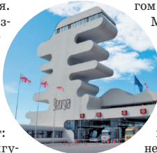
Пограничный переход в С рли

Проехать из России в Грузию через Абхазию легально нельзя. Никак. Возможность въезда из Грузии в Абхазию во многом зависит от политики абхазского