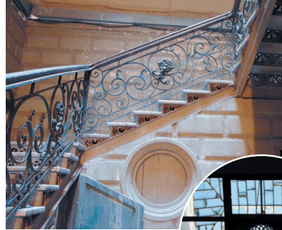
Подъезд жилого дома в центре

в этот период составляя более половины населения города.