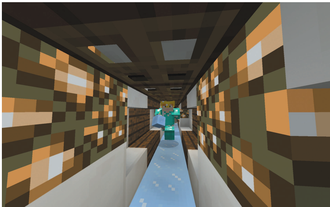
По туннелю высотой в два блока и шириной в один и полом из плотного льда, прыгая на бегу, можно передвигаться невероятно быстро

в грядку у себя на ферме, вы можете ускорить рост стебля с помощью костной муки, хотя получить сразу созревший плод не получится. Чтобы собрать наибольший урожай, обязательно поливайте бахчу водой и убедитесь, что четыре блока по бокам стебля пусты.