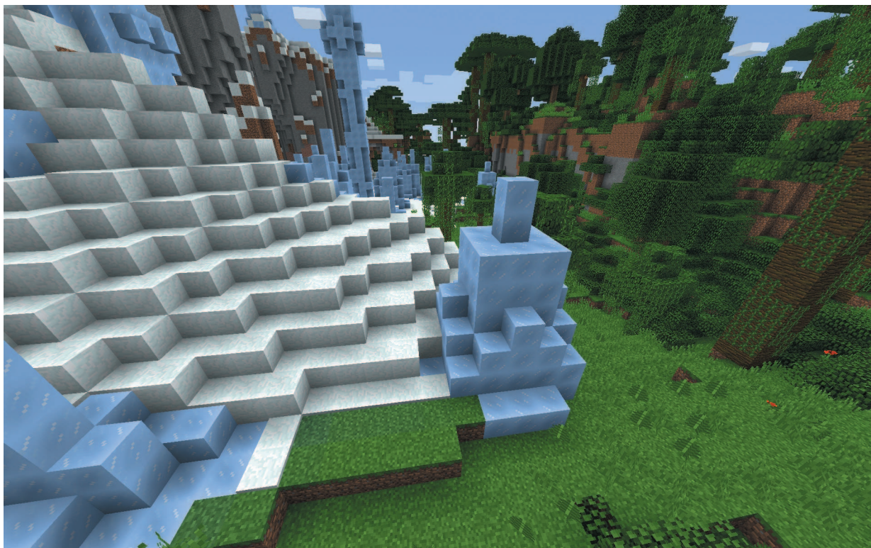
Практически невозможно найти рядом друг с другом два биома с контрастными температурами — например, джунгли и ледяные пики

Варианты снежных биомов: заснеженные склоны, заснеженный пляж, замерзшая река и ледяные пики. Снег повсюду. Если и встречаются деревья, то только ели. В более теплых частях снежных биомов, например в заснеженной тайге, встречаются волки.