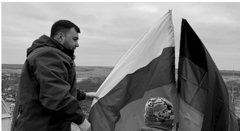
Глава ДНР Денис Пушилин поднимает российский флаг в освобожденном Гранитном

конец смогут ездить в Донецк без блокпостов — до этого дорога занимала аж 36 часов вместе со стоянием в очереди. Спрашивает главу, что будет с социальными выплатами, пенсиями, тарифами ЖКХ. Тот отвечает, что все наладят, а тарифы будут куда симпатичнее украинских.