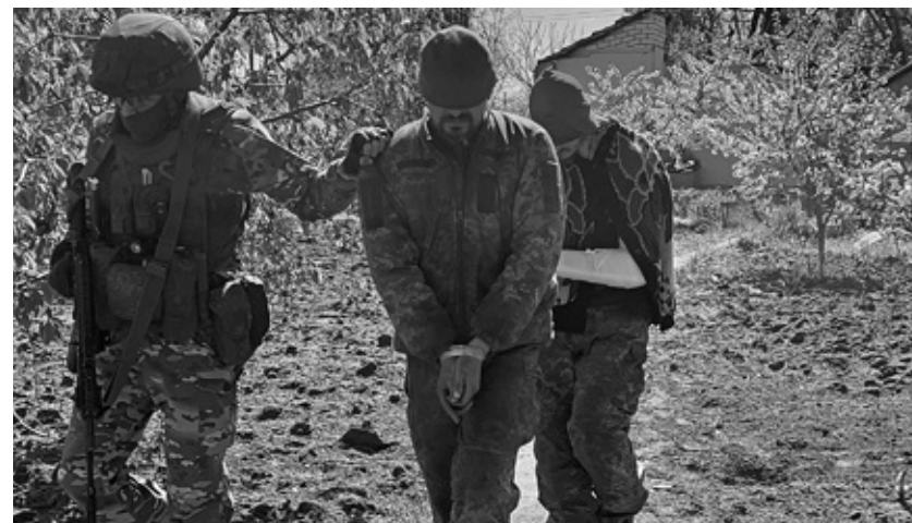
Первые украинские пленные: «Мы не хотели, нас заставили»

— Луганская, Донецкая области. В техническом плане комплектация очень плохая. И топлива нет, и машины поломанные, все старое, ничего нет нового. У нас в батальоне новеньких, которые только поприходили по первым контрактам, около 115 человек. Никто не рассчитывал, что такие действия развернутся.