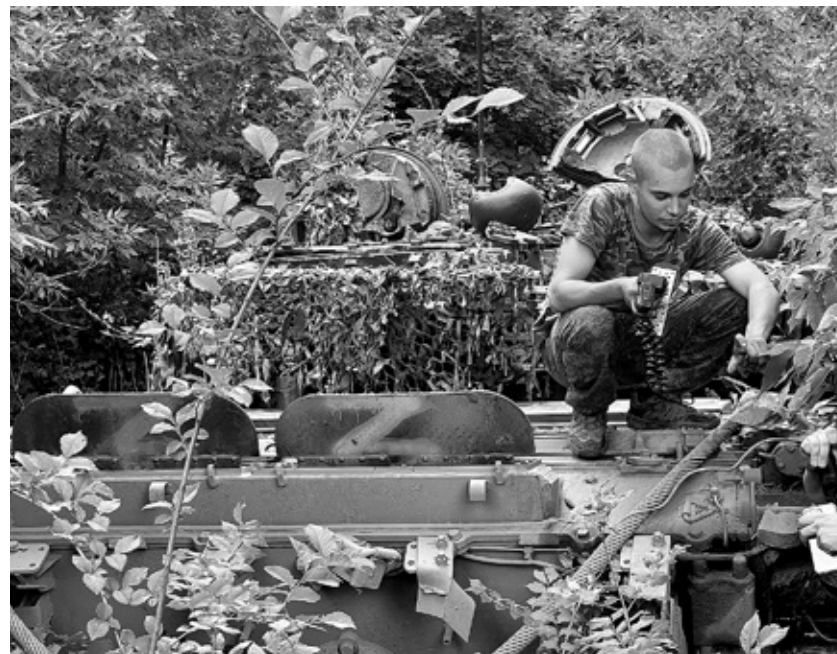
«На переднем у нас передышка...»

Если представить армию противника, восемь лет осаждавшего Донецк, пастью какого-то зверя, то Пески были самым крупным его клыком, впившимся рядом с сердцем Донбасса. Некогда престижный дачный район областного центра превратился в синоним смертельной угрозы, которая восемь лет собирала свою жатву — жизнями мирных жителей Донбасса. Отсюда, практически из пригорода, велись постоянные артиллерийские обстрелы столицы ДНР. Этот же населенный пункт рассматривался командованием ВСУ и как плацдарм для штурма самого Донецка.