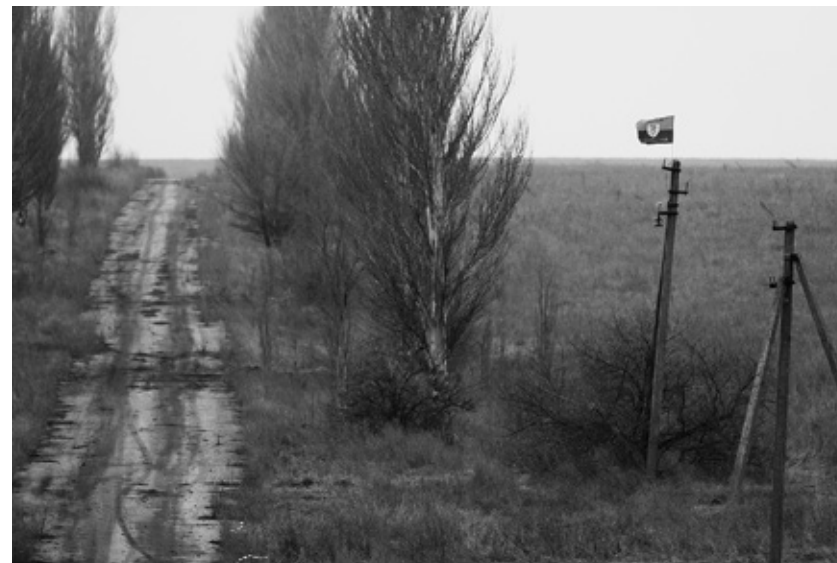
Красно-черный флаг «Правого сектора» виден издали

Красно-черный флаг «Правого сектора» (запрещен в России. — Авт. ) виден издали — кто-то из очень увлеченных неонацистов забрался на опору ЛЭП у дороги, соединяющей Докучаевск и поселок Николаевка, и приладил там свой прапор. До недавнего времени территория между этими населенными пунктами была «серой зоной». И на этой дороге можно снимать фильм о постапокалипсисе — она поросла высокой травой и мхом, слева — по-