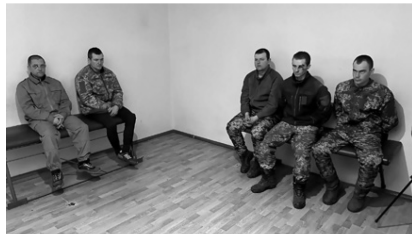
Сдавшиеся украинцы больше воевать не хотят

— У меня дома жена беременная на седьмом месяце, двое детей от первого брака. Сестры и братья.