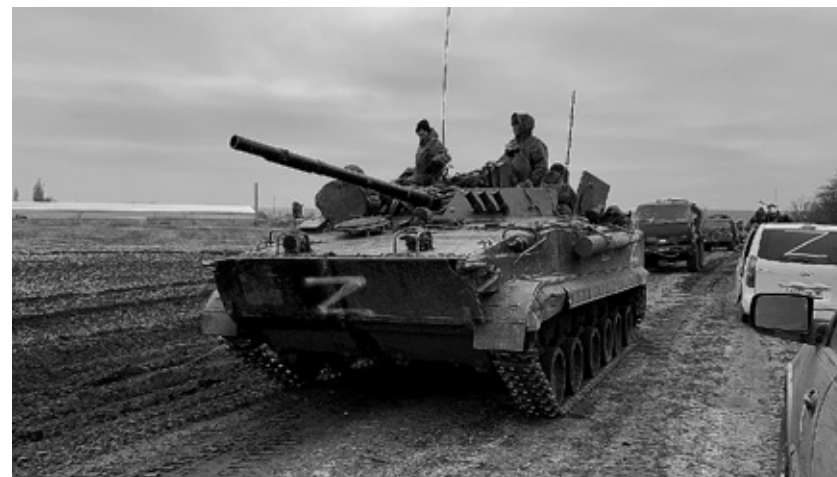
Всё только начинается

«Байден, так тебя и так! Обманул!» — матерится коллега, выскочив из машины и уйдя по щиколотку в плодородный донбасский чернозем. Земля, как обещал президент США, не промерзла, но военная спецоперация России все-таки началась. Бесконечные колонны бронетехники армии ДНР тянутся на запад и юго-запад дорогами, которыми почти 80 лет назад их деды освобождали Донбасс от фашистской оккупации. И точно так же мессили солдатскими сапогами раскисшую под снегом и танковыми траками «чваку».