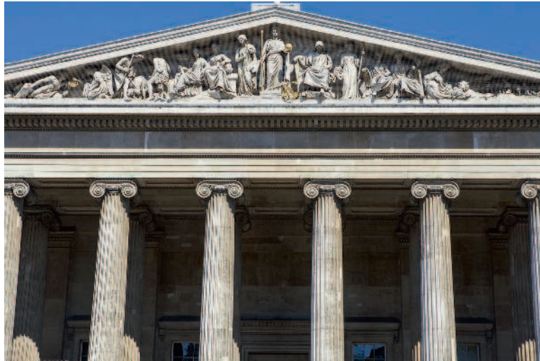
Вид фасада Британского музея. Лондон. Цветная фотография

фигурными рельефами и скульптурами можно было видеть златокудрого Аполлона и его спутниц – муз. Внутреннее пространство храма разделяли два ряда колонн. Здесь горел огонь и находился жертвенник, а также размещались самые ценные дары, прежде всего скульптуры.