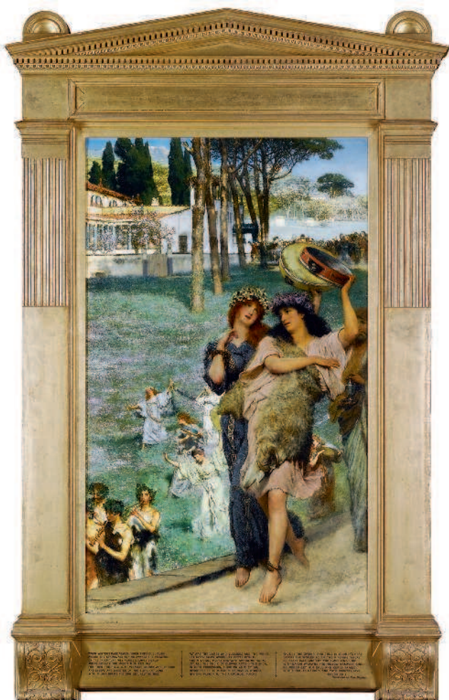
Лоуренс Альма-Тадема (Lawrence Alma-Tadema), 1836–1916 Праздник. Холст, масло. 1882

Отголоском древних мистерий сегодня служит механизм коммеморации – сохранения в общественном сознании памяти о значимых событиях прошлого (6). Прежде всего он действует в музеях, посвященных выдающимся людям или историческим событиям. Во многих отношениях деятельность