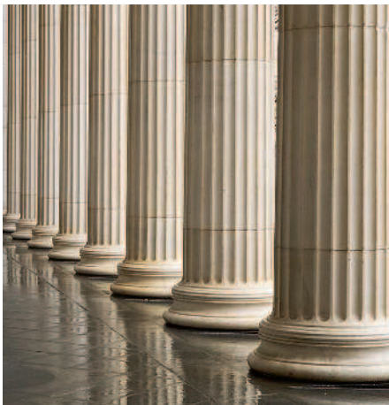
Вид внешней колоннады здания Музея изобразительных искусств им. А. С. Пушкина. Москва Цветная фотография

красоты, исповедуемый античностью, представлялся грекам одним из способов приобщения к божественному. То, что впоследствии будет определено как эстетическое (чувство формы, цвета, ритма, симметрии), способствующее внутреннему умиротворению и духовному возвышению человека, в Древнем