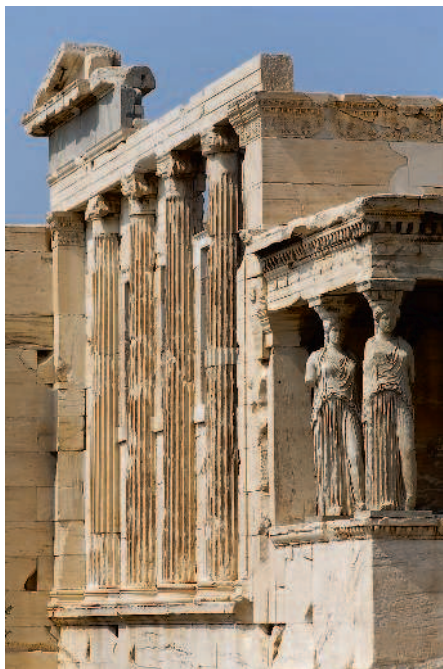
Вид храма Эрехтейон. Афины Цветная фотография

Монументальные формы греческих храмов принесли в пространство музея заданность внутренней планировки: лестницы и широкие проходы для торжественных процессий, вместительные залы и своего рода «алтарное место» для самого ценного экспоната. По сложившейся традиции роль «алтаря» в Пушкинском музее играет полукруглая часть (в древнегреческой архитек-