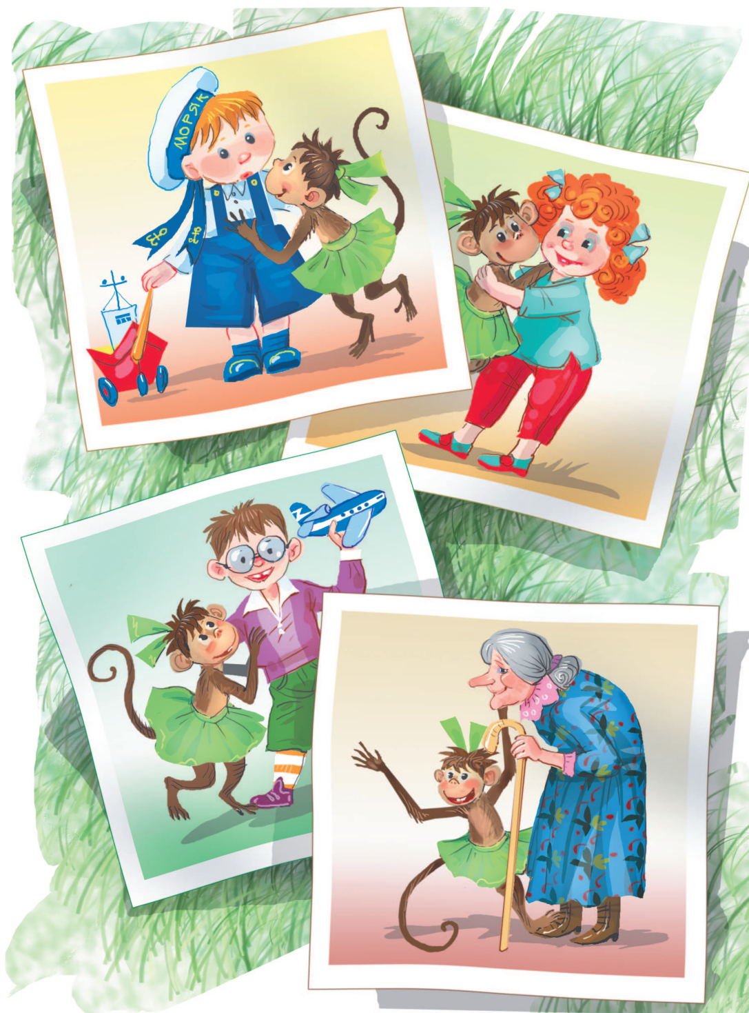
Рисунки Г. Соколова