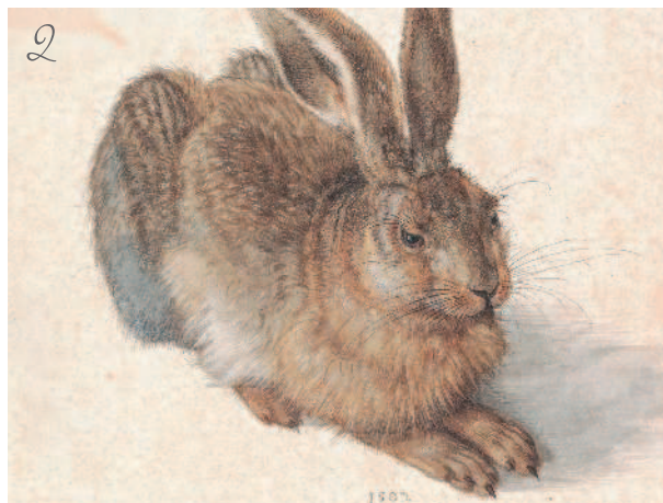
Альбрехт Дюрер. Заяц. 1502 г.

Совет от Натали. Вы можете начать осваивать технику живописи, которая описывается в этой книге на любой бумаге (даже просто офисной).