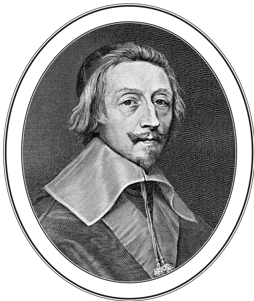
Арман-Жан дю Плесси, герцог де Ришельё (1585—1642)