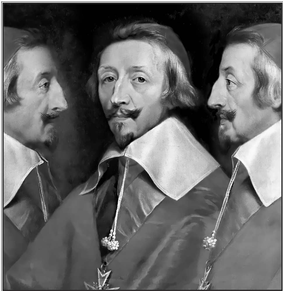
Филипп де Шампань. Тройной портрет кардинала Ришельё. 1637 (1642?) г.

именно дует ветер, и не мозолить королю глаза, когда он в дурном расположении духа». Юный епископ, всесторонне обсуждая вопрос, каким образом надо держаться с королевскими любимцами и фаворитками, приходит к убеждению, что их следует посещать «ввиду необходимости приносить жертвы как добрым, так и злым богам: первым — для того чтобы помогали, последним — чтобы не делали зла». При дворе следует «воздерживаться от многоглаголения и как можно внимательнее слушать, отнюдь не дозволяя себе принимать рассеянного, равнодушного или меланхолического вида; напротив того, надо выказывать живейшее сочувствие к предмету, о котором идет речь, но проявлять это сочувствие более вниманием и молчанием, чем словами, или жестах одобрения. Особенно важно заручиться расположением таких служащих, которые в чем-либо могут пригодиться». К числу их принадлежат, между прочим, почталыоны. «Письма, которые опасно сохранять, следует немедленно сжигать» и т. п. В заключение дю Плесси рассматривает случаи, когда «необходимо прибегать к притворству и лести».