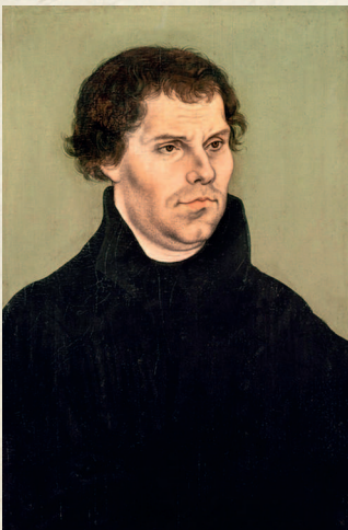
Мартин Лютер 1483–1546

И тем не менее разговор о Возрождении мы начнем не столько со сравнения северного Ренессанса и итальянского Ренессанса, сколько с постановки очень интересной проблемы. Северный Ренессанс, в первую очередь нидерландский, можно назвать миростроительным,