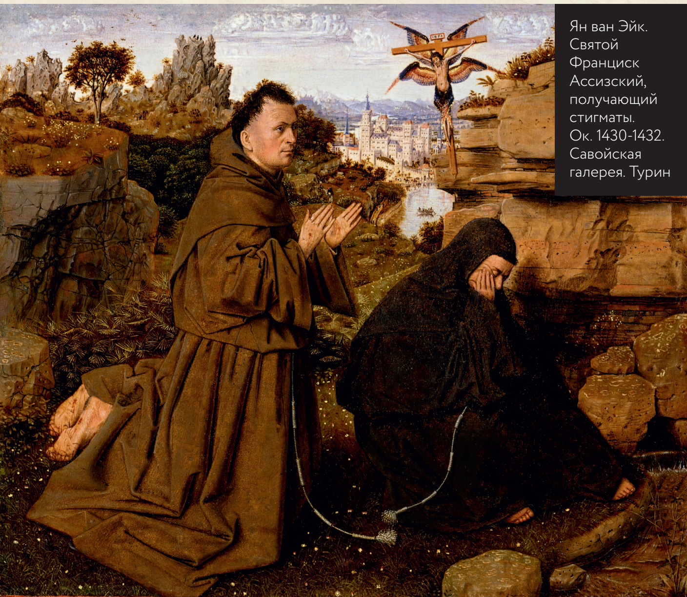
Ян ван Эйк. Святой Франциск Ассизский, получающий стигматы. Ок. 1430-1432. Савойская галерея. Турин

а итальянский — человекосотворительным. Итальянская культура все свое внимание сосредотачивает на понятии человека, она возвращается к идее того, что Господь создал человека по образу Своему и подобию. Это очень интересное положение — сотворение человека по образу Своему и подобию, и Ренессанс итальянский настолько сосредоточен вокруг проблем человеческой личности, что мы его можем называть культурой, связанной