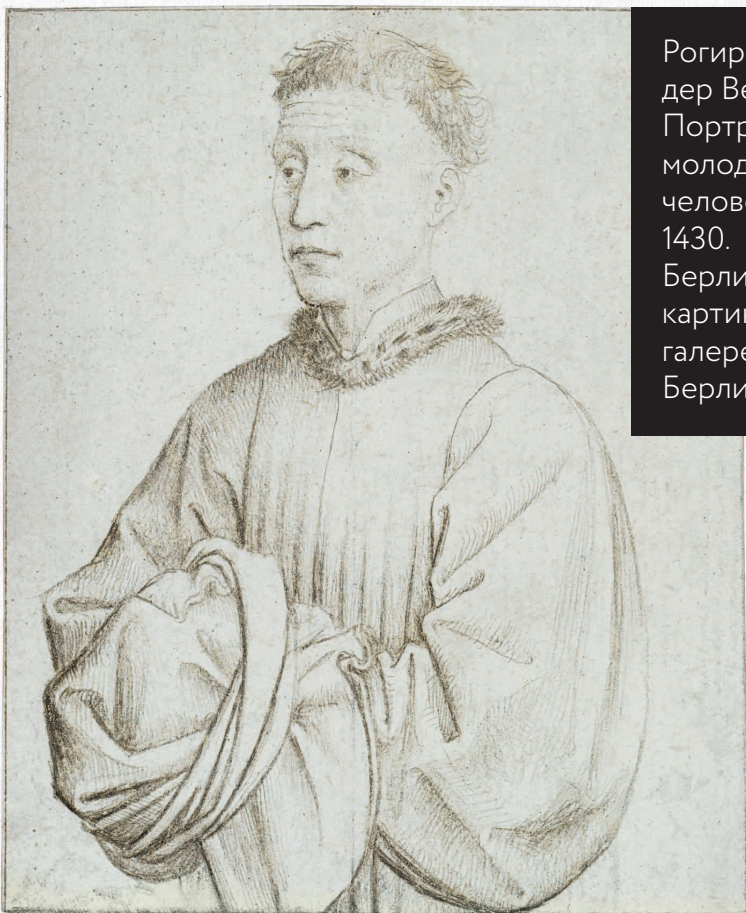
Рогир ван дер Вейден. Портрет молодого человека. 1430. Берлинская картинная галерея. Берлин

редь это книга Михаила Владимировича Алпатова «Художественные проблемы итальянского Возрождения» и книга Алексея Федоровича Лосева «Эстетика