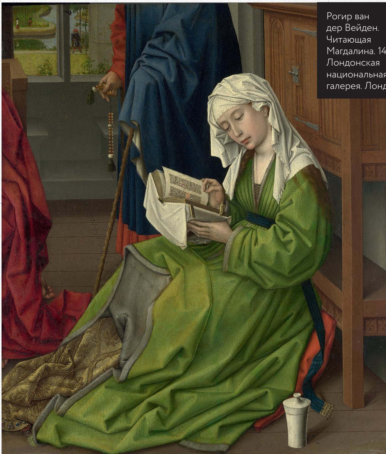
Рогир ван дер Вейден. Читающая Магдалина. 1438. Лондонская национальная галерея. Лондон

пораженной стяжательством, безнравственностью и равнодушием.