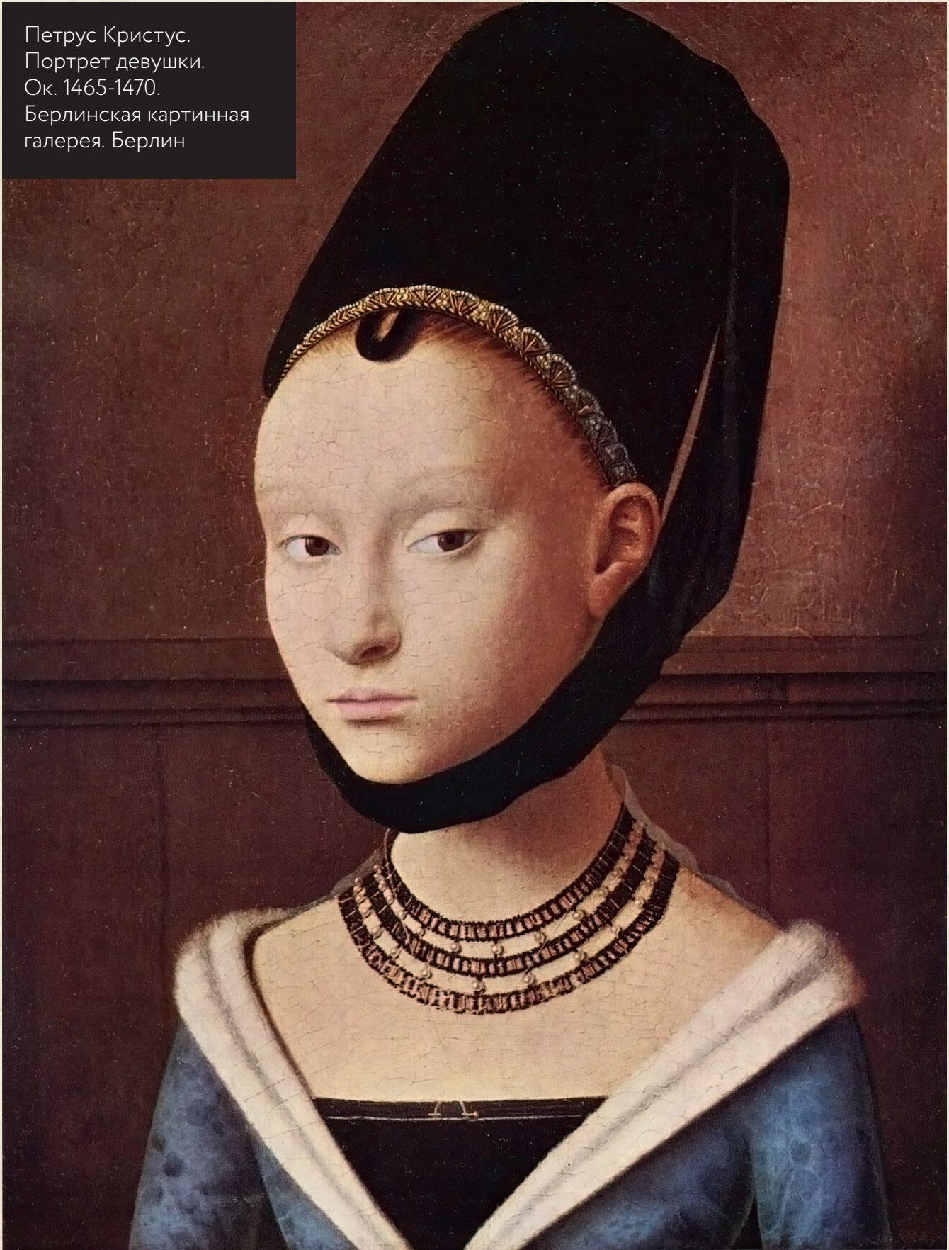
Петрус Крестус. Портрет девушки. Ок. 1465-1470. Берлинская картинная галерея. Берлин