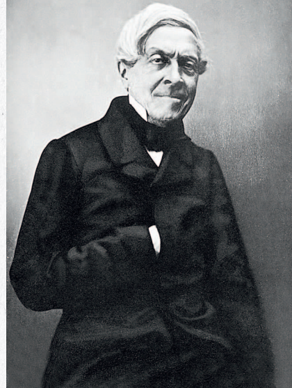
Жюль Мишле (фр. Jules Michelet) 1798–1874

Автором термина «Ренессанс» (франц. Renaissance) является французский историк-медиевист Жюль Мишле (1798–1874). Это понятие употреблялось и раньше, например, в текстах Джорджо Вазари (итал. Rinascimento от лат. renasci «рождаться опять»), но именно Мишле ввел его в научный оборот.